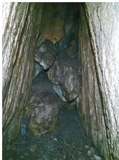
Trémie d'un côté.