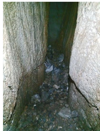
Le point bas du trou.