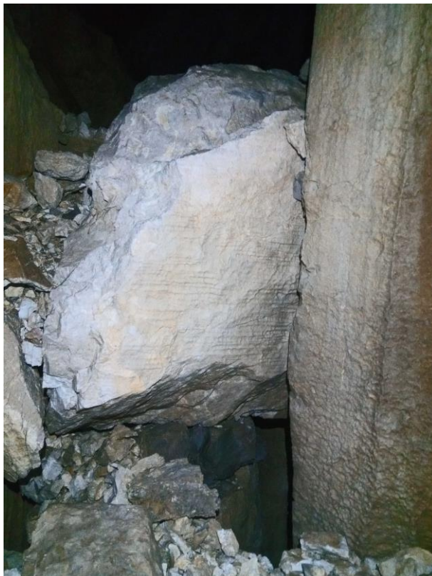
Arrivée au puits de l'Alice, bloc coincé.