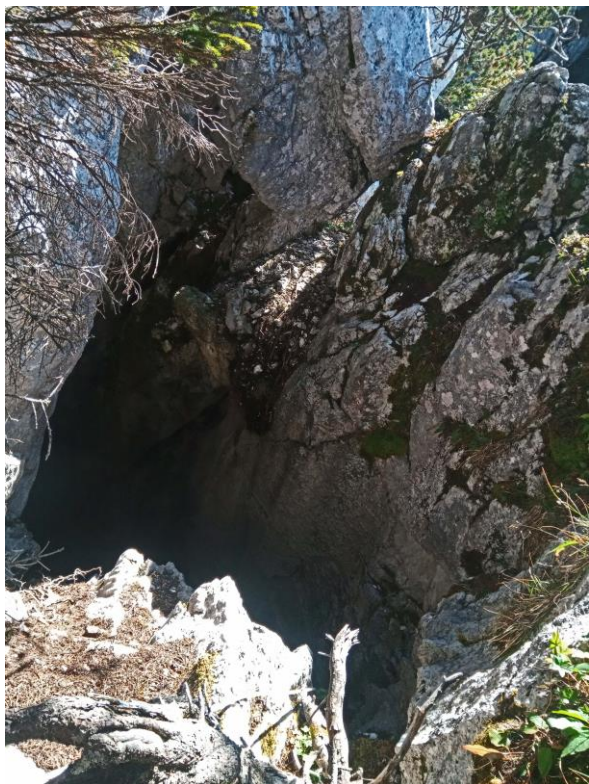
L'entrée du gouffre, vue à la verticale.

d'un beau gouffre de qui se révèle plus profond que prévu, car le palier vers -8 m se prolonge en un puits subvertical où les pierres rebondissent sur 30 voire 40 m... beaucoup plus en tout cas que les 15 m estimés par Domi.