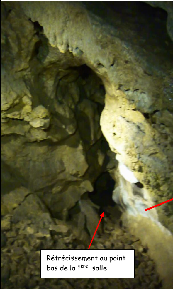
Rétrécissement au point bas de la 1 ère salle

En fait, cela débouche sur un ressaut de 3 m qu'il est facile de descendre en tenant la corde à la main. En bas, ce que nous découvrons est très surprenant ! Outre des milliers d'araignées faucheuses qui courent partout à notre arrivée, nous arrivons sur une salle de décantation totalement incongrue là