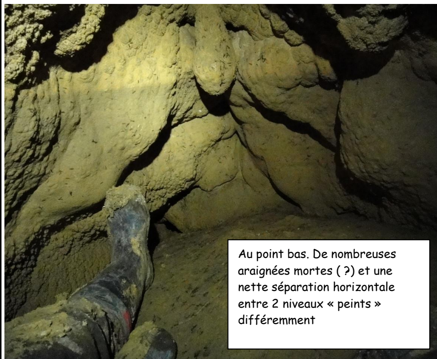
Au point bas. De nombreuses araignées mortes (?) et une nette séparation horizontale entre 2 niveaux « peints » différemment

où nous sommes. Le niveau de l'eau variable a laissé des traits de niveau sur la paroi sans que l'on puisse affirmer que l'endroit soit en permanence fossile. Au point bas, 2 petits départs impénétrables seront à agrandir pour voir ce qu'il y a