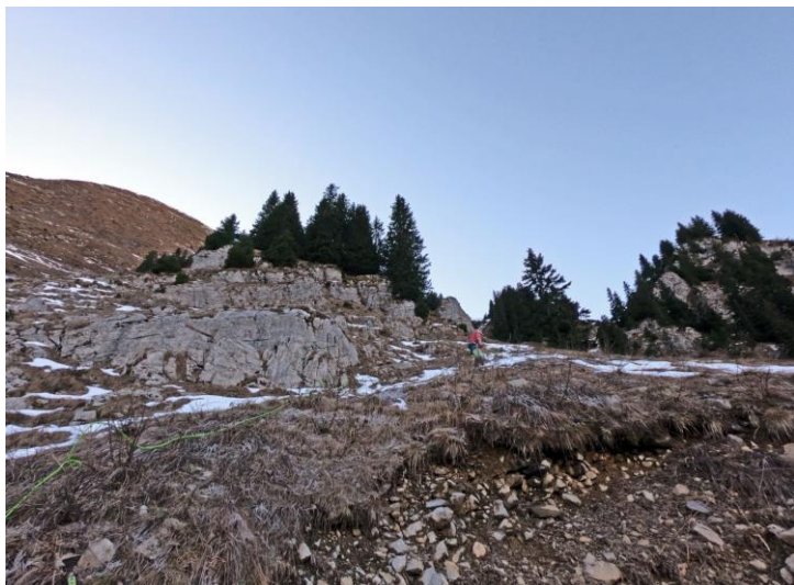
Mine de rien, l'accès final est raide...

Il faudra sans doute attendre la fin du printemps pour la suite, l'accès étant délicat dans des pentes enneigées.