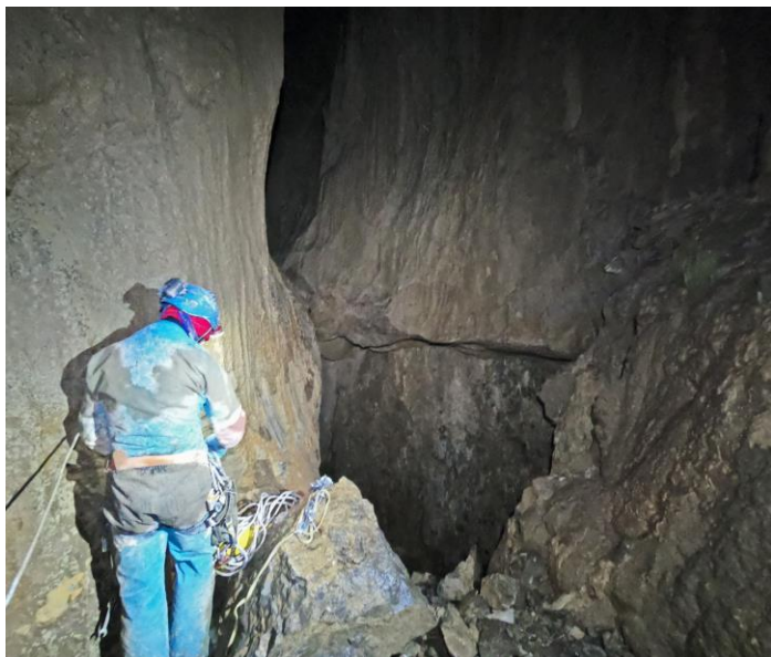
Deuxième puits en première...