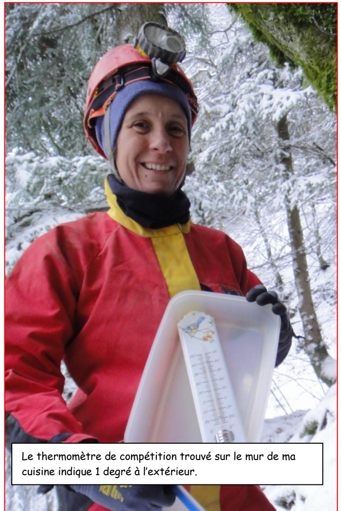
Le thermomètre de compétition trouvé sur le mur de ma cuisine indique 1 degré à l'extérieur.

sans risque de me faire dévorer. Résultat des courses, je n'ai même pas réussi à allumer l'engin (problème de piezo). Je suis bien content de ne plus avoir à utiliser une