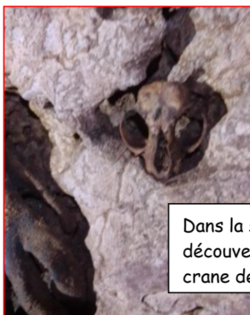
Dans la salle monidé, Laetitia a découvert un petit crane. Un crane de saumon ?