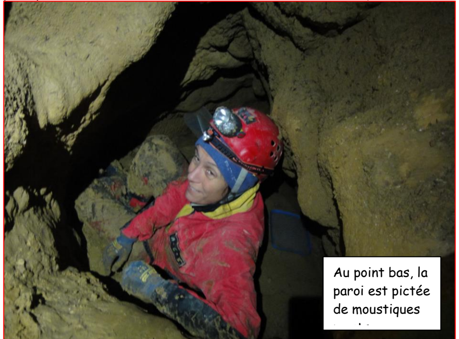
Au point bas, la paroi est pictée de moustiques

telle usine à gaz ! Bravant la pluie arachnéenne, j'ai quand même pu constater l'absence de courant d'air ainsi que de perspectives de suite sur cet amont décimétrique. Au point bas, le départ creusé par Vincent BDC la dernière fois, me semble ne mener nulle part. L'autre départ, situé à proximité, n'est guère plus engageant mais nous y relevons cependant un très léger courant d'air soufflant et une température autour de 7° C. Creuser la boue n'est pas du tout engageant avec une vision quasi nulle d'une suite éventuelle. Rien que d'aller y jeter un œil, nous sommes dans un état lamentable. Nous repartons