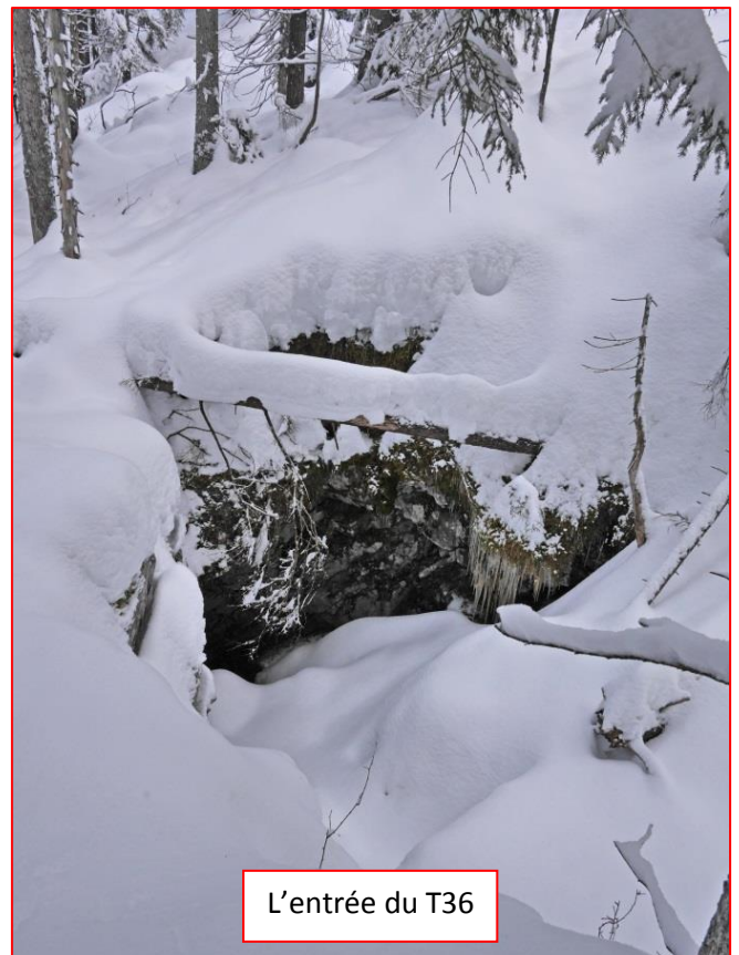
L'entrée du T36