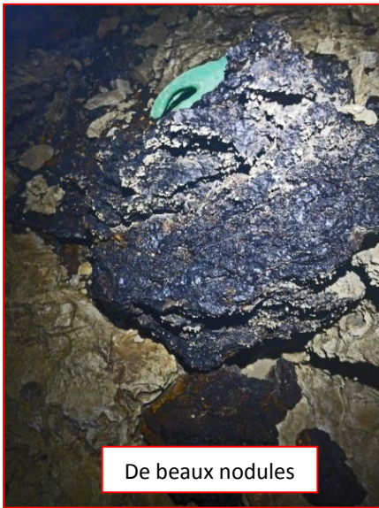
De beaux nodules