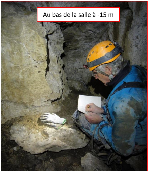
Au bas de la salle à -15 m