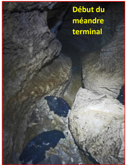
Début du méandre terminal