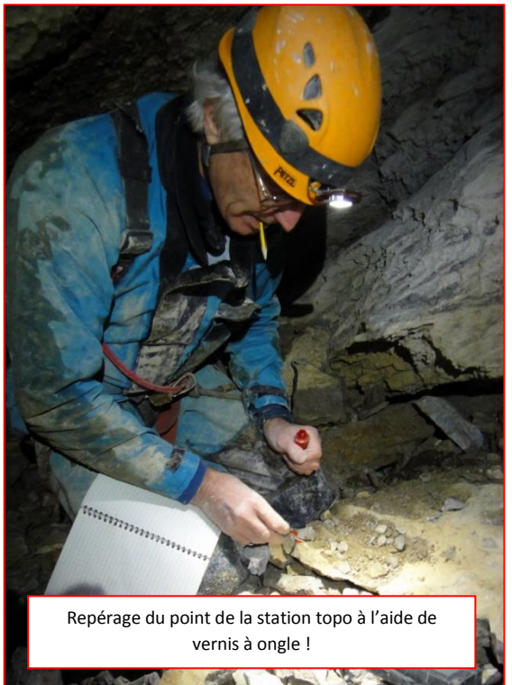
Repérage du point de la station topo à l'aide de vernis à ongle !