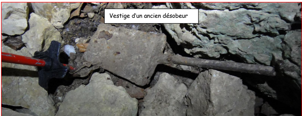
Vestige d'un ancien désobeur