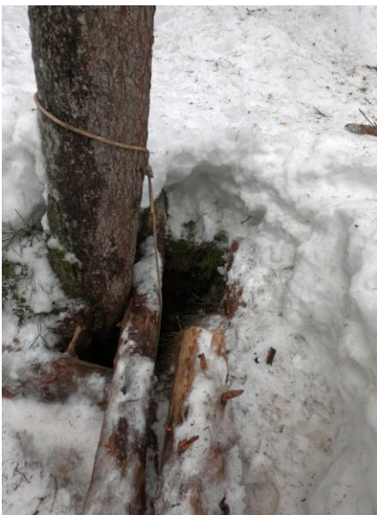
L'entrée dégagée à minima...

Petite sortie avant les excès du soir ( ?)... Montée à midi, trace déjà faite mais devenue bien humide avec le redoux, moins de \frac{3}{4} h pour rejoindre le gouffre (tanne) Langusta avec tout le matos de désob lourde. Les troncs sur l'entrée, soudés par le gel, demandent à être bien secoués pour être écartés aussi je me limite au minimum, juste de quoi passer. Descente un peu « terreuse humide », le courant d'air est fluctuant. Au fond il y a pas mal de déblais, quelques gros blocs mais surtout des graviers-poussière de calcite, je me contente de pousser ça sur le côté faute de partenaire pour évacuer avec le bidon. Je peux aussi creuser la paroi gauche formée d'une alternance de strates fines de glaise, roche, calcite. Mais je n'ai qu'un petit burin... Je peux voir mieux le passage, après un à deux mètres qu'il sera possible de grattouiller avec masse, gros burin voir barre à mine (avant de passer à du plus percutant), une fissure verticale se dessine. Le courant d'air vient bien de là (il souffle par bouffées). Je n'arrive pas à jeter un caillou assez loin pour sonder, l'atteindre sera le but de la prochaine séance. Vu le contexte je ne sors pas le perfo du sac et quitte prestement les lieux. Il faudra revenir avec du matos adéquat, mais à deux cette fois !