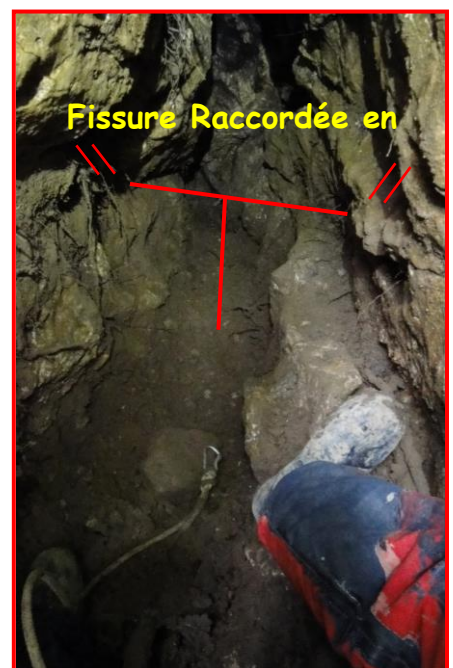
Progression de la taupe en chef