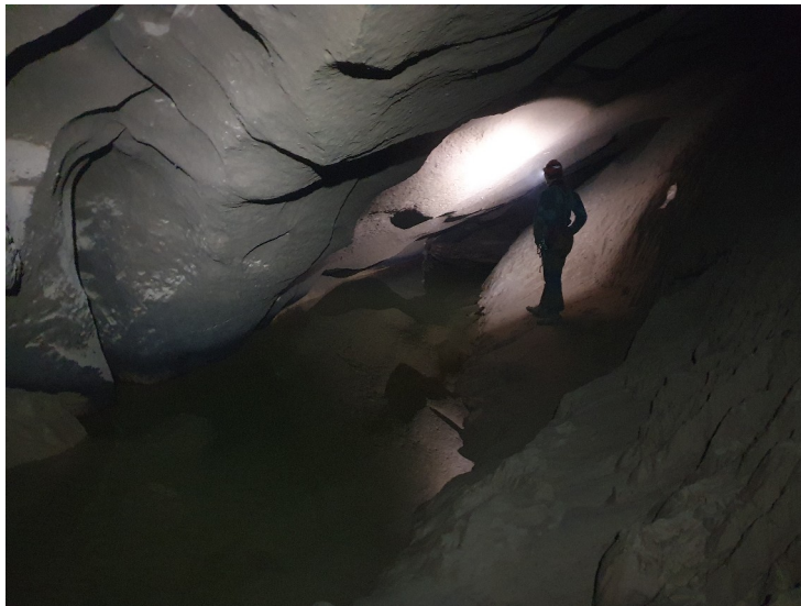
Le lac en question

Finalement, on remonte et direction le balcon de la Cuspide qui est la voie d'accès pour l'oasis. On prend notre pause repas au sommet du balcon (une compote pompote a explosé dans notre sac à pique-nique c'est génial, n'hésitez pas à boycotter la marque) et après on monte dans la conduite forcée qui permet de l'éviter, on prend le petit passage qui nous permet d'arriver de l'autre côté du balcon. Ici commence un long toboggan qu'il nous faut équiper pour descendre en sécurité et être sur de remonter : on prend donc un petit bout de concrétion qui sate si on est trop brusque et une petite lunule comme départ de main-courante et un gros béquet en qui cet fois on a réellement confiance comme tête de puit. On passe notre 40m dans le toboggan et on fait un rabout avec la 10m pour le petit ressaut que l'on découvre au bout du toboggan. Et enfin nous voilà dans une grande galerie magnifique décheté avec du sable et de l'eau qui nous mène tout droit à l'oasis (c'est faux la galerie tourne à un moment).