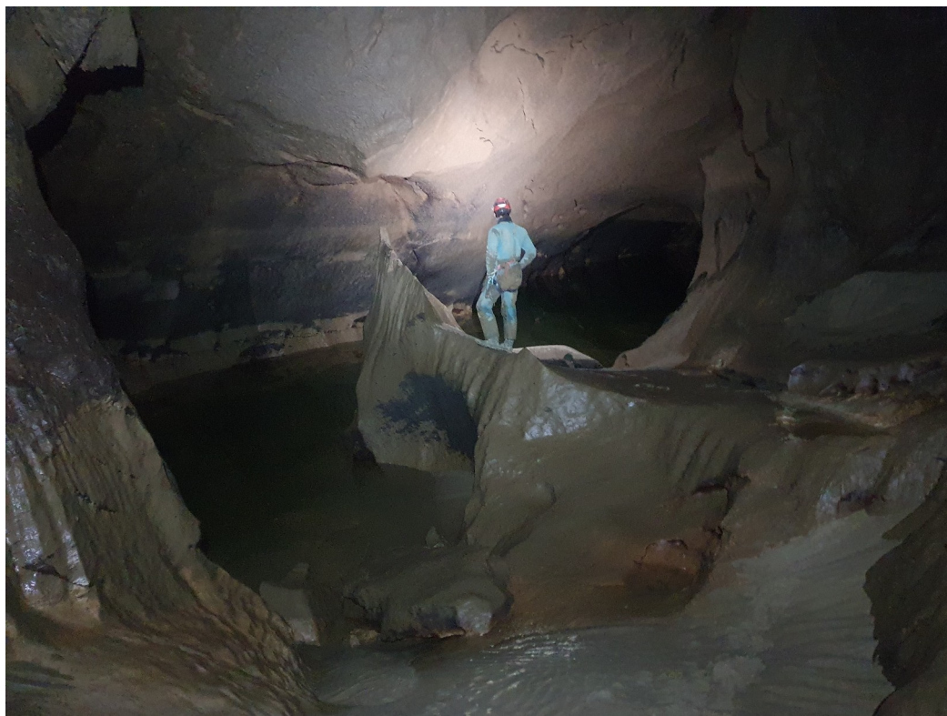
Le lac avec la pointe, et moi.

Au bout de la galerie on arrive donc sur un grand lac avec une pointe rocheuse juste devant, c'est très jolie.