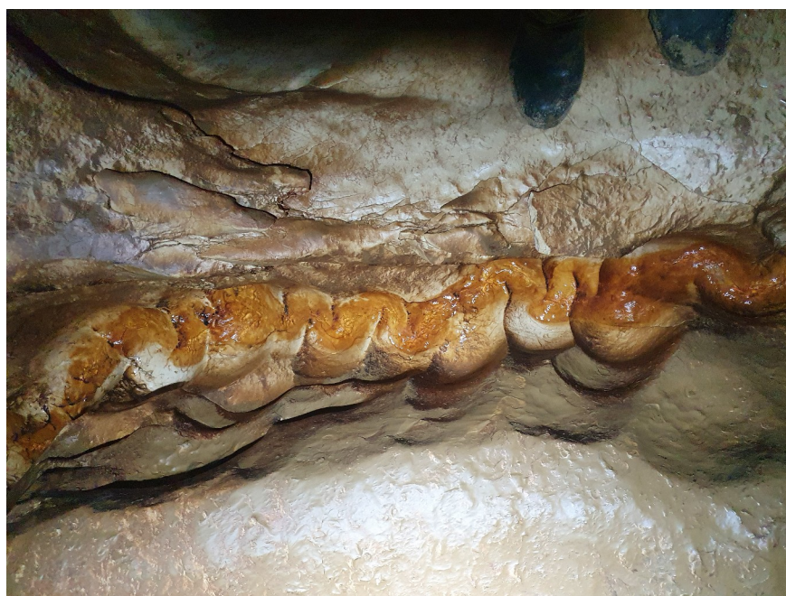
On a aussi un jolie bébé méandre qui vient de la droite (on dirai un serpent).