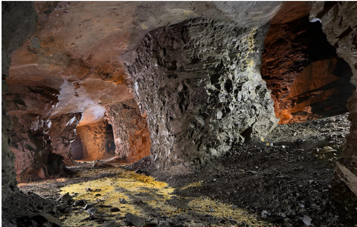
Chambre d'exploitation dans la couche la plus profonde de la carrière.

La première entrée que nous avons trouvée ne correspond pas à celle que j'ai pointée d'après les travaux de Robert Durand. Et pour cause, c'est un ancien tunnel ferroviaire. Nous suivons l'ancienne plateforme de la voie pour rapidement trouver le carreau et l'entrée. On s'mouille le cul, et on est dedans.