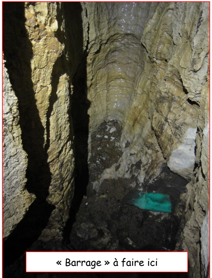
« Barrage » à faire ici