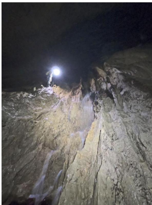
le même au retour. Le débit a changé !