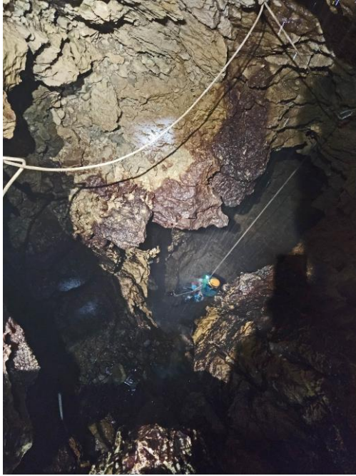
le haut du puits arrosé.

Nous décidons de remonter en laissant de côté la topo qui de toute façon demandera des conditions plus sèches au fond. Les jeunes montent devant et vont mettre encore des marches pour faciliter certains passages. Nous nous chargeons de remonter tout le matériel superflu. Le débit a nettement augmenté et on se mouille tant dans les passages bas que dans la plupart des ressauts et puits (mais on n'est plus à ça près, au moins pour moi).