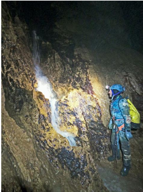
Domi et la cascade du toboggan.

Nous décidons de remonter en laissant de côté la topo qui de toute façon demandera des conditions plus sèches au fond. Les jeunes montent devant et vont mettre encore des marches pour faciliter certains passages. Nous nous chargeons de remonter tout le matériel superflu. Le débit a nettement augmenté et on se mouille tant dans les passages bas que dans la plupart des ressauts et puits (mais on n'est plus à ça près, au moins pour moi).