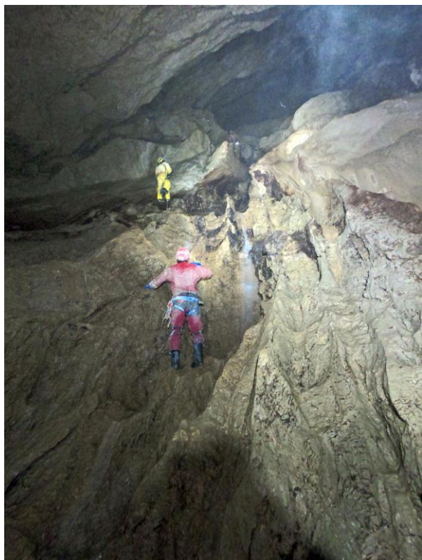
Le toboggan vu du bas à la descente...