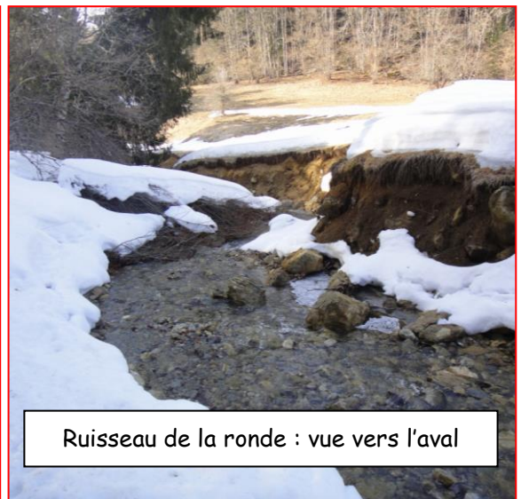
Ruisseau de la ronde : vue vers l'aval