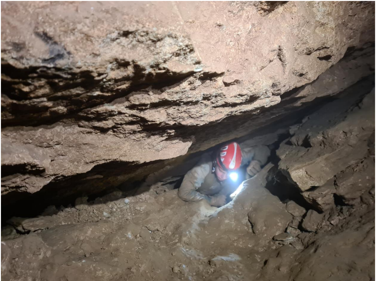
La sortie des Etroitures