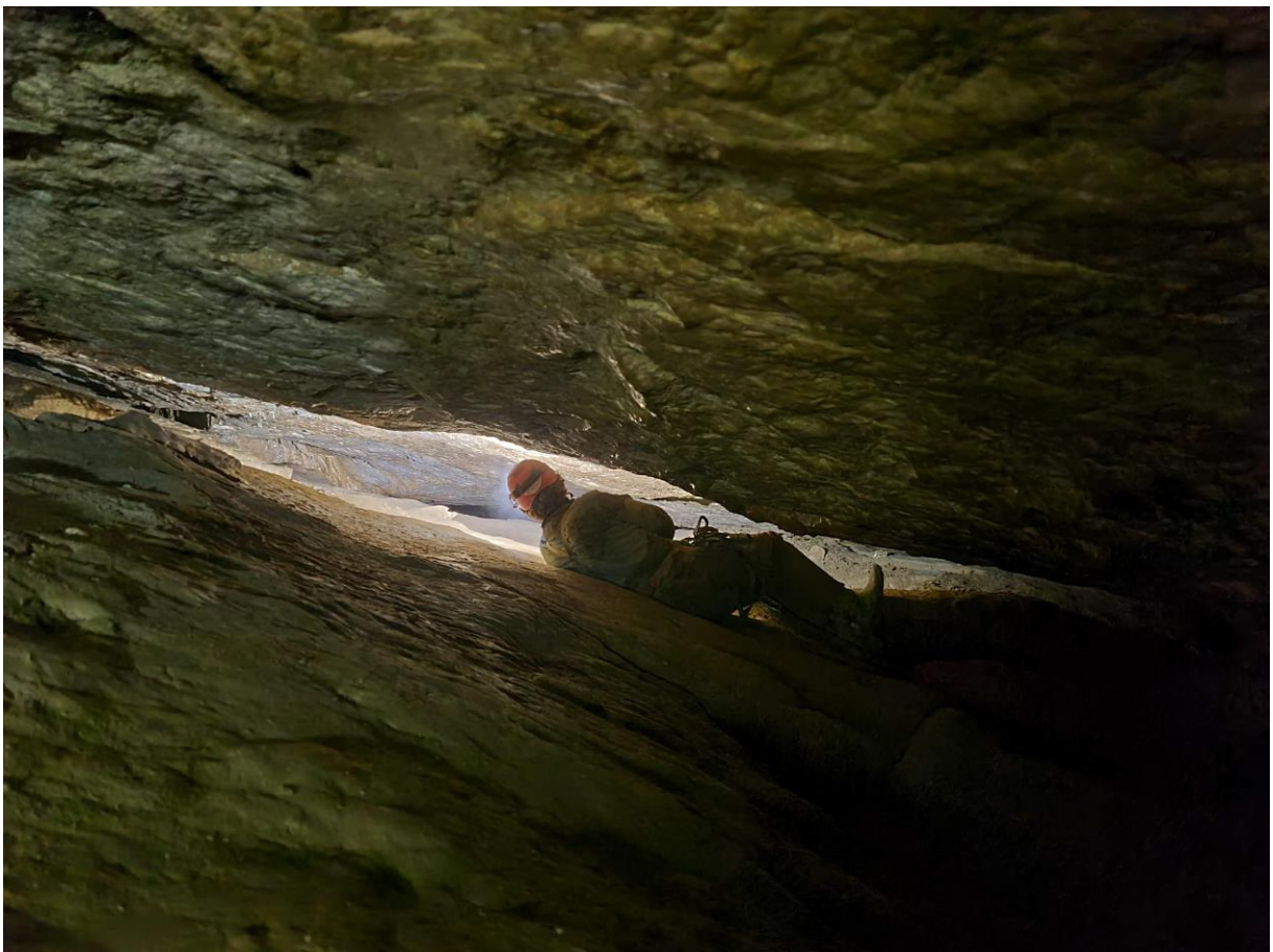
L'arrivée dans la galerie Polyphème