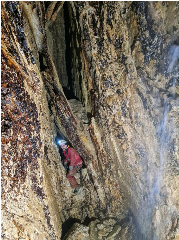
Valentin da la salle de la douche