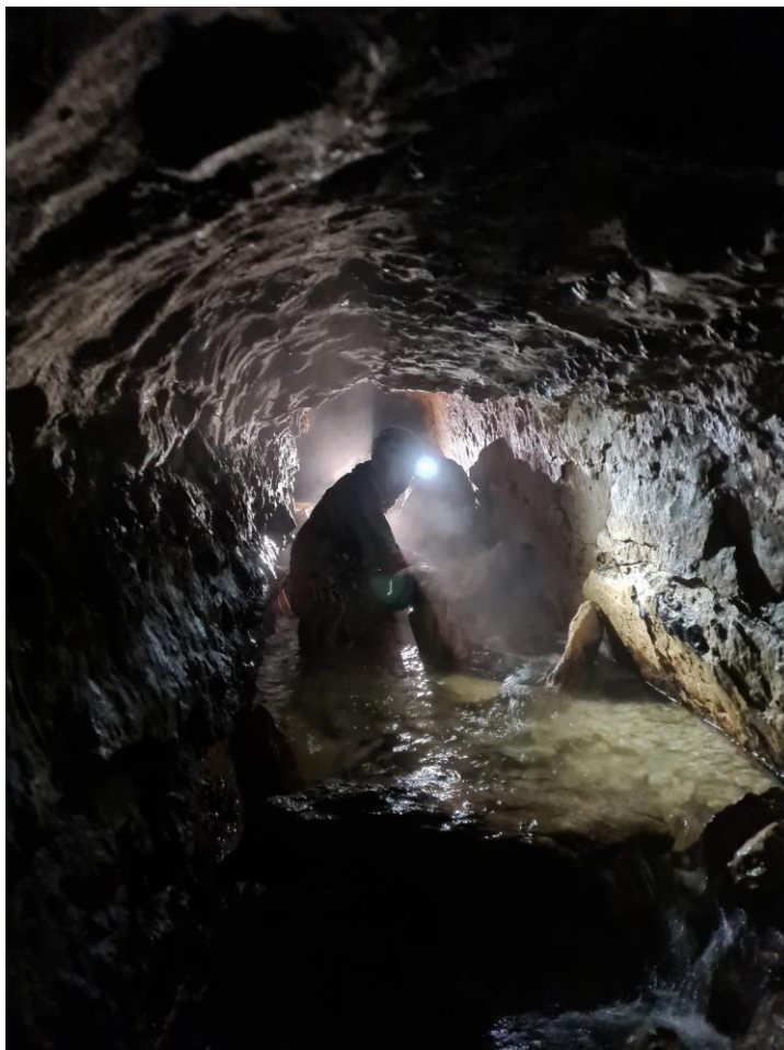
Valentin dans le ruisseau