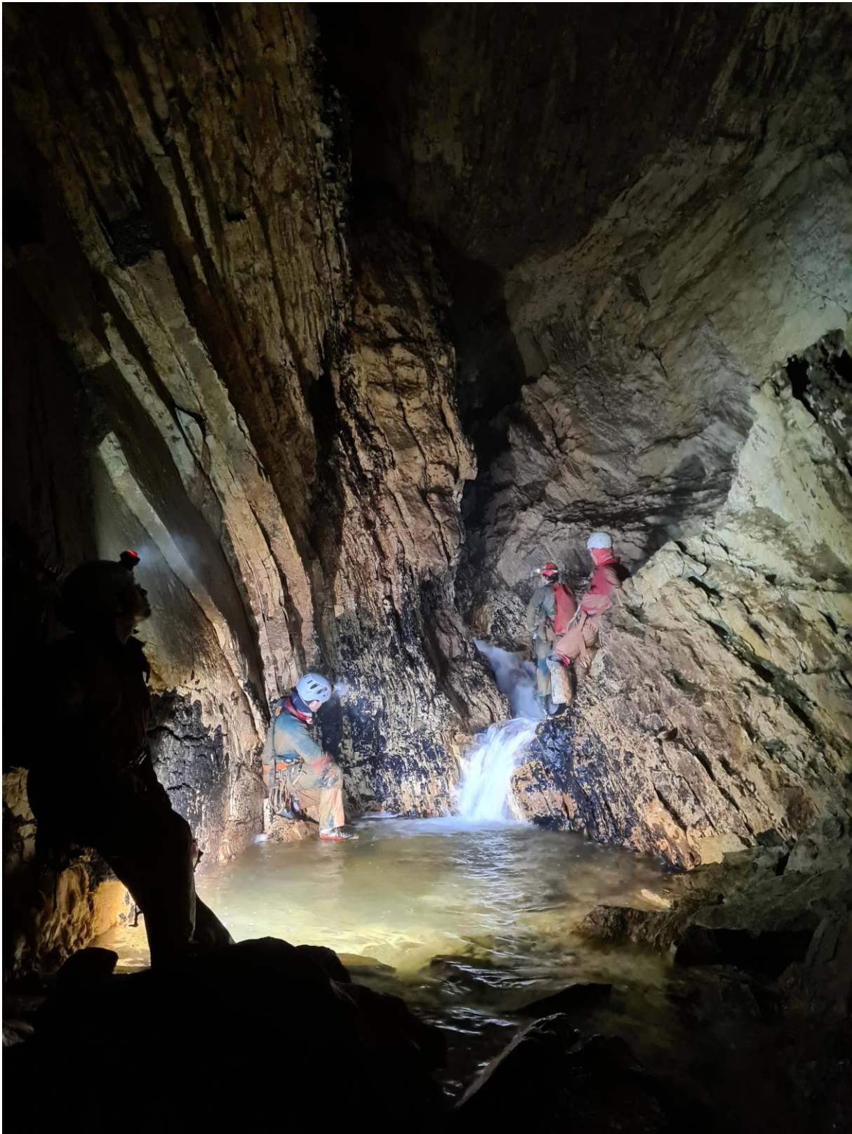
Le ruisseau de la toussaint