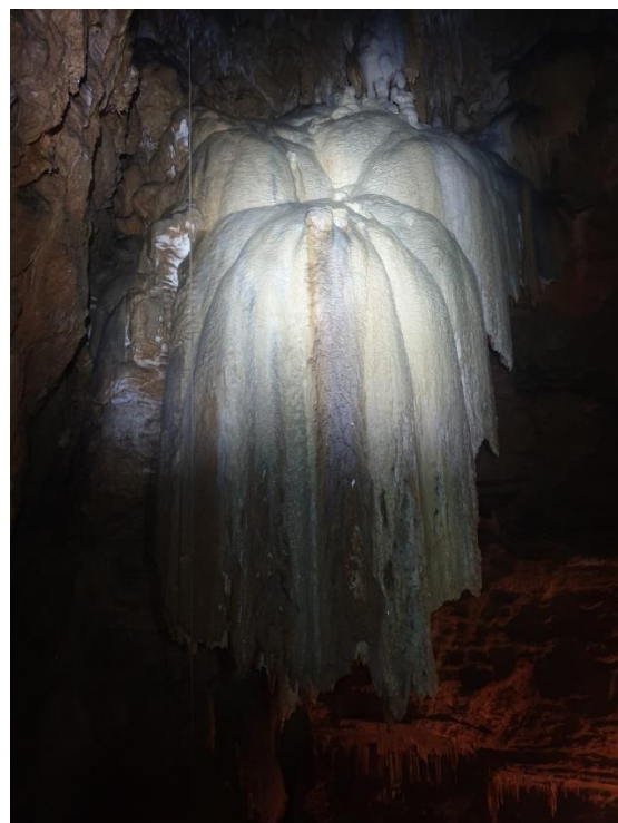
Grande coulée blanche