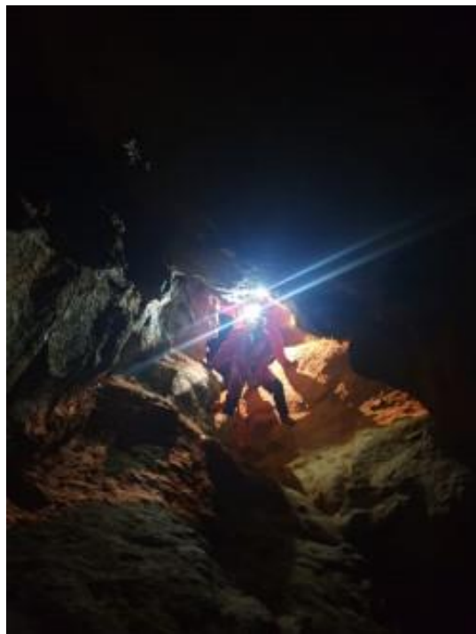
Passage en opposition