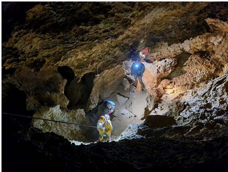
Caroline entrain de remonter un puit

La descente se passe très bien ! Nous arrivons au contournement du black Hole (carrefour entre le Black Hole et vers réseau travaux public). D'ici nous sommes 6 motivés à descendre ce fameux black Hole...il porte très bien son nom ! Ça fait flippééé ! (l'équipement RAS).