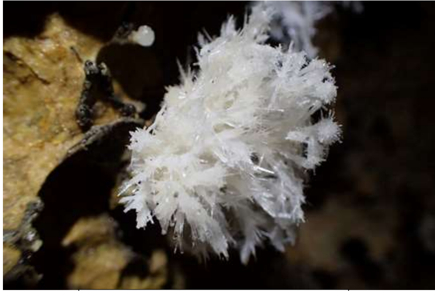
Une aragonite parmi des milliards d'autres

Aller nous remontons à la queuleuleu dans le P100 pour gagner du temps, la corde tiens le coup ! ☺ Ensuite direction la galerie des travaux publics. Et là encore un spectacle monstrueux, Rien à dire je vous laisse admirez <3