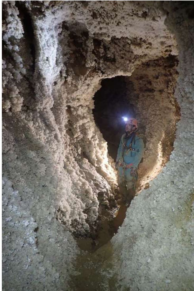
Wouaaa et c'est ça sur quelque centaines de mètres !!