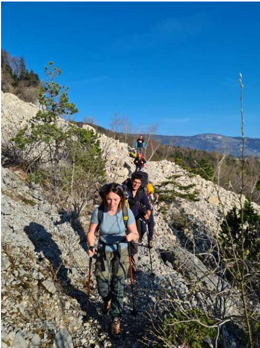
Pendant l'approche...ça pique

Bien équipé et beau comme des gardons nous entamons l'entrée à 10h45.