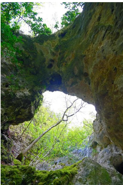
l'arche, les arbres donnent l'échelle.

Revenu vers la base des barres rocheuses nous la suivons, toujours vers le Nord, il n'y a que de vagues traces mais voilà le beau pont rocheux dont j'avais connaissance dans une vieille revue spéléo. C'est déjà spectaculaire, l'arche est bien à 10 m de haut et elle est large de plus de 5 m, le tout bien caché dans la forêt.