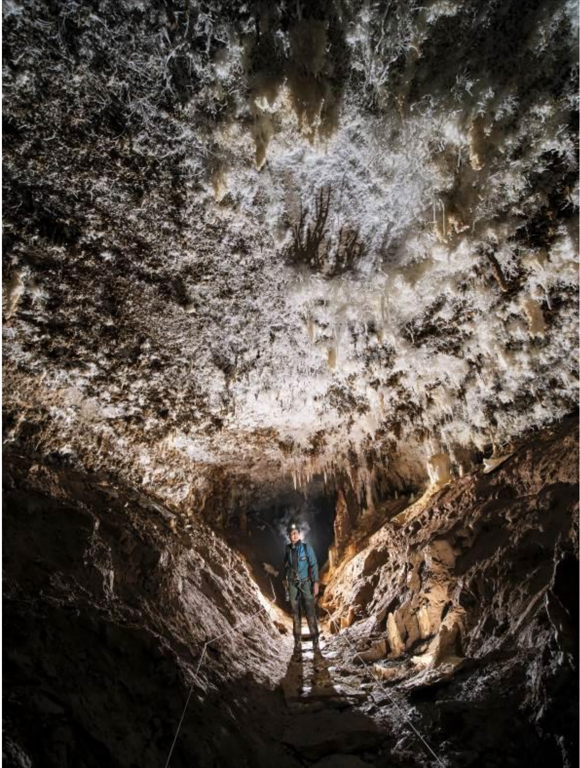
Malaval, réseau « Blanches super blanches »

Le premier prix pour les photos effectuées pendant cette semaine est attribué à une des équipes Roumaines.