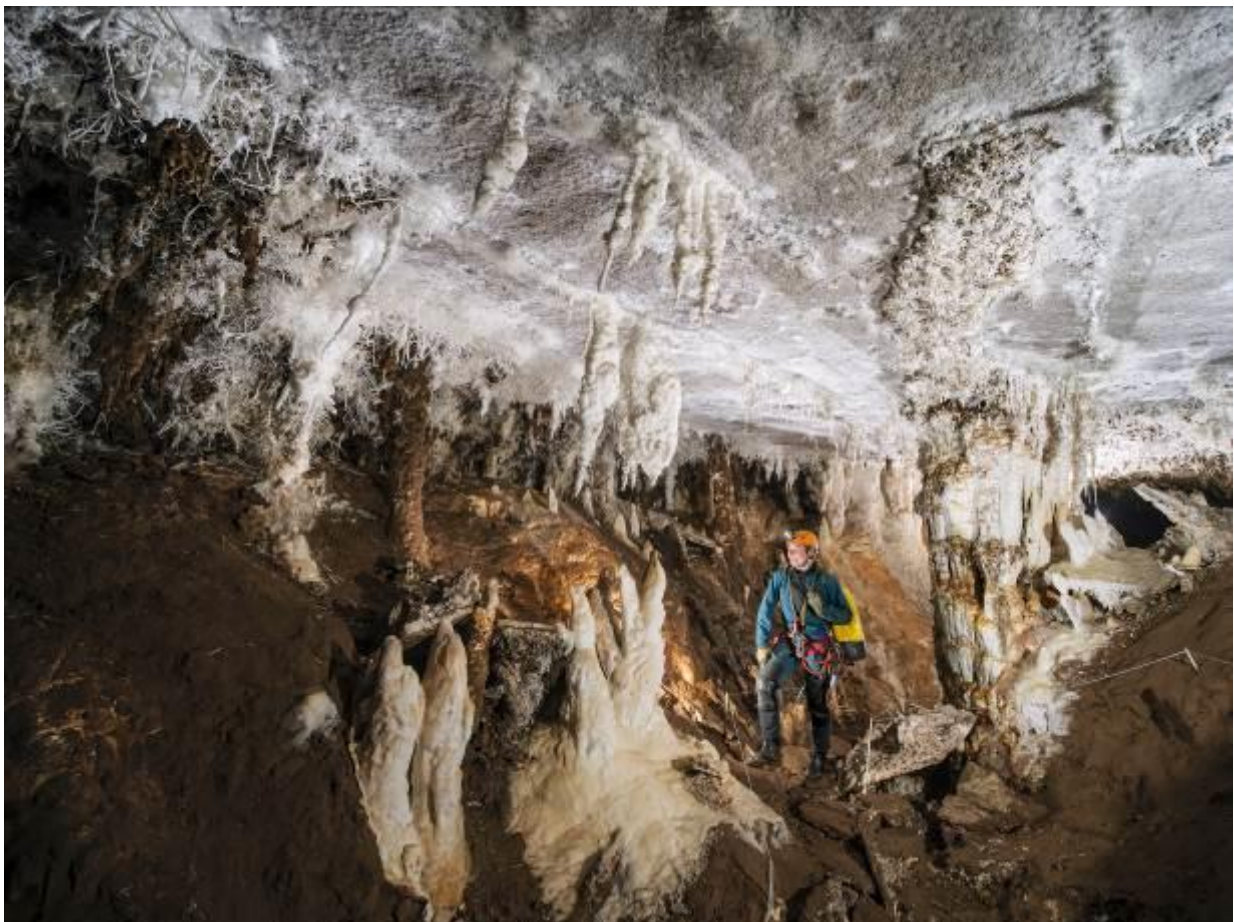
Malaval, réseau « Blanches super blanches »

Le Speleo Photo Meeting SPM 2022 a lieu à Chanac en Lozère. Il est organisé par Rémi Flament. C'est un concours international de photos spéléos. Nous, l'équipe franco-suisse-britannique, sommes avec une quinzaine d'équipes de différents pays: Espagnoles, Roumaines, Tchèque, Américaine, Japonaise, Italienne. Nous avons le choix de photographier quatre cavités parmi les douze proposées pour enfin produire dix photos. De plus, le sponsor