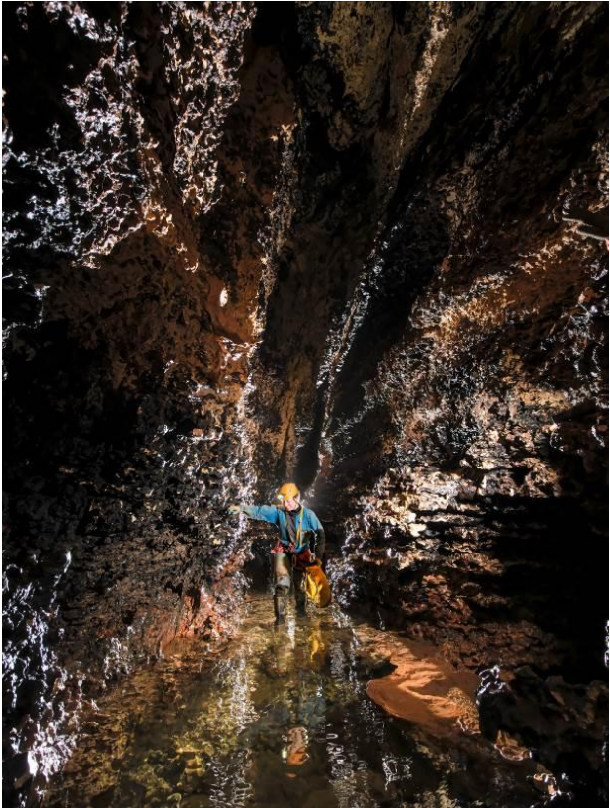
Coutal, le chaille typique de la grotte

5 mai 2022 - Journée de repos avec visite touristique des Gorges du Tarn