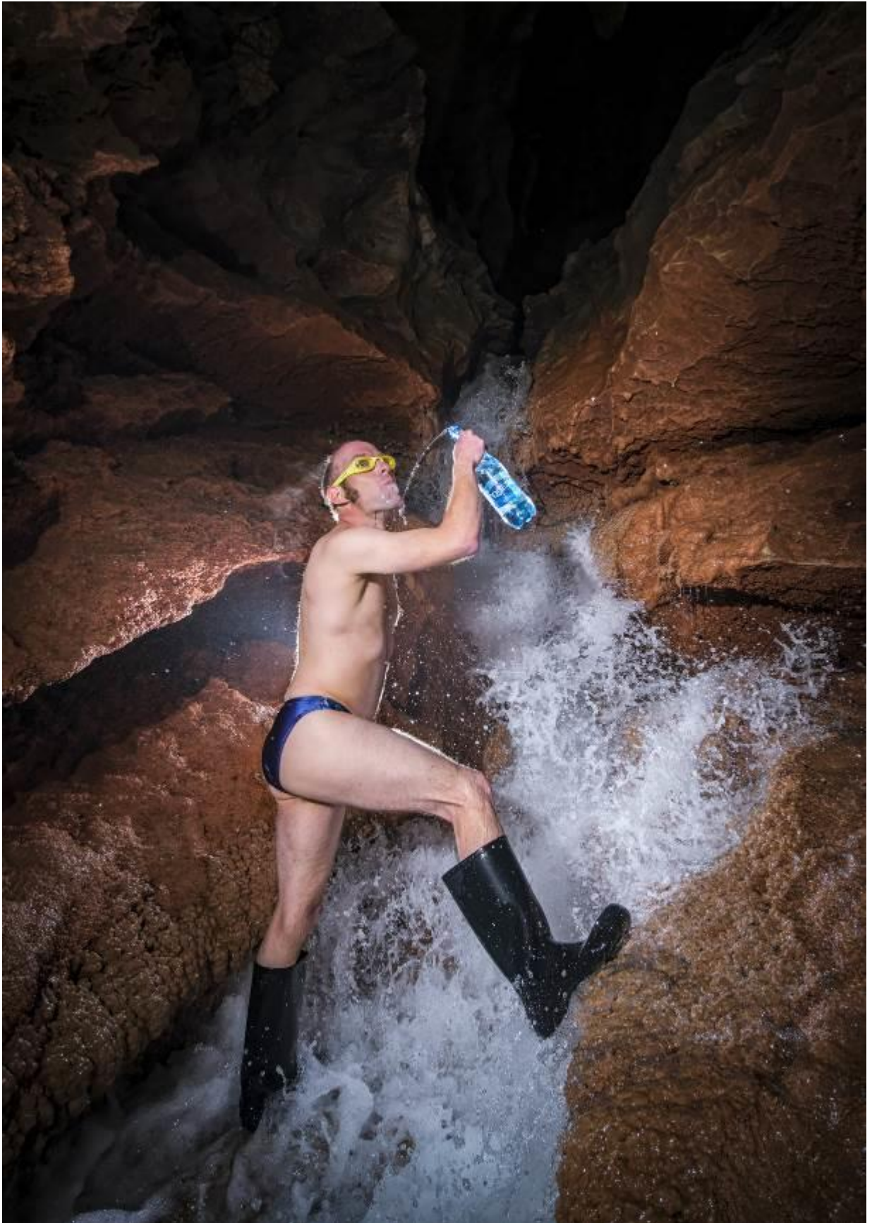
Tanteyrou, la photo qui remporte le concours « Quezac »