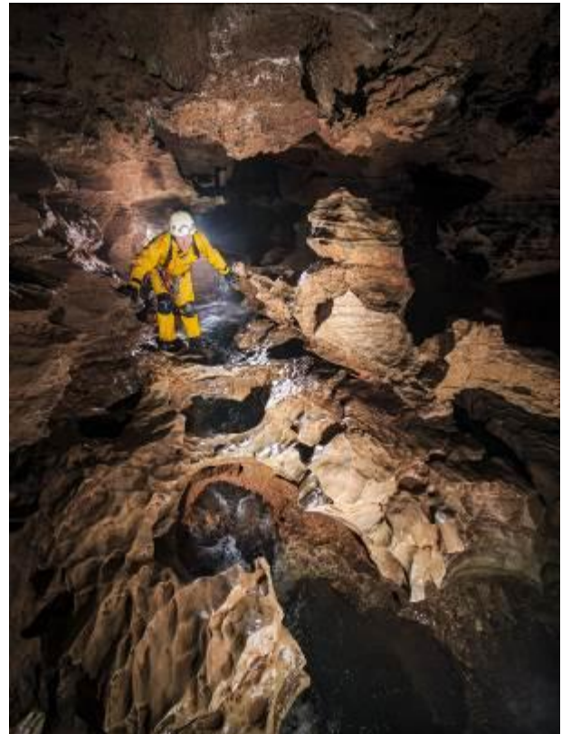
Tantayrou siphon et galerie vive