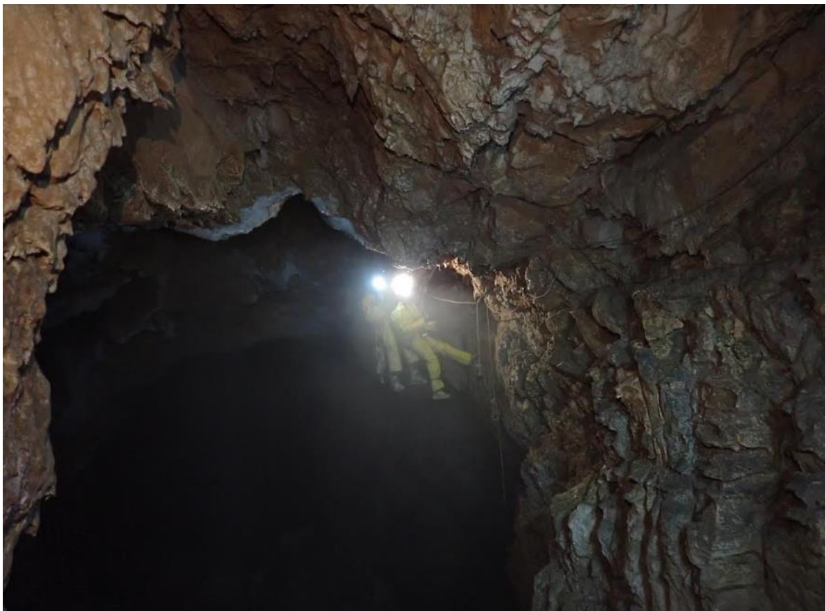
Figure 9 : Léa et David qui assurent.