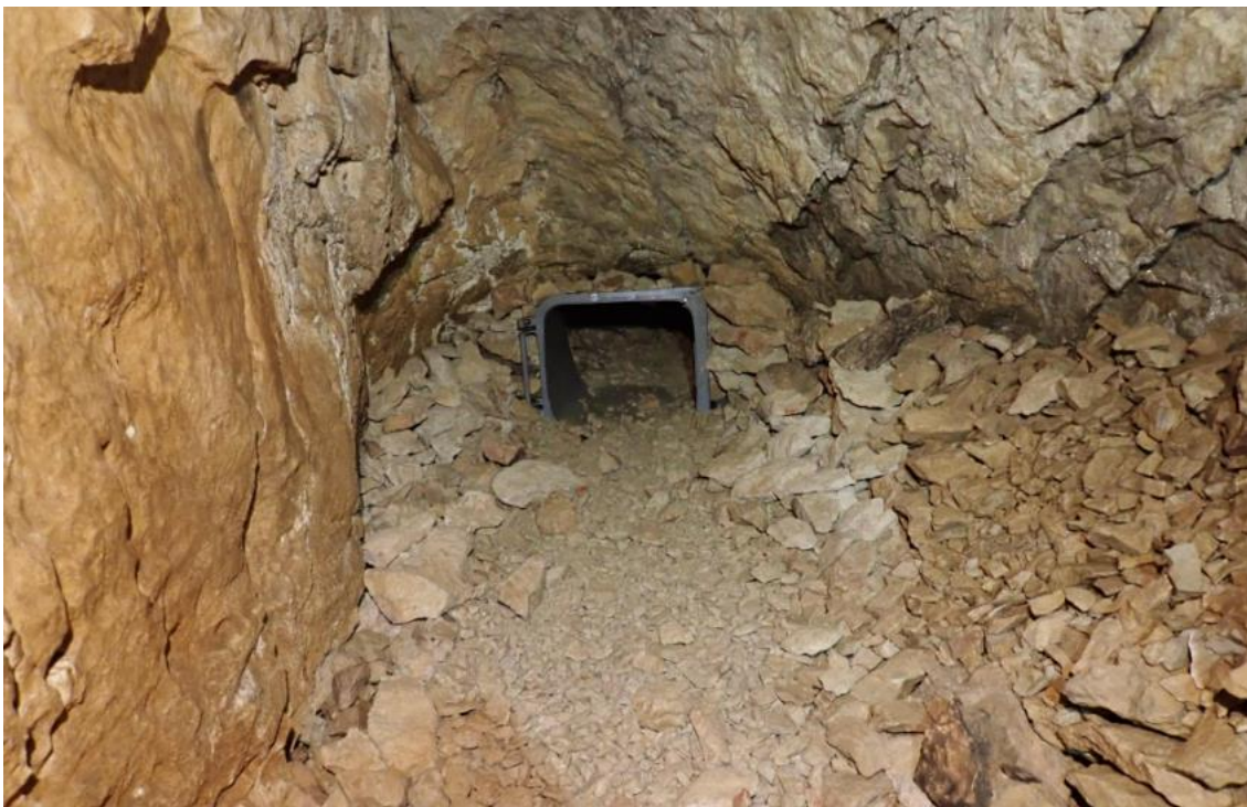
Figure 5 : La poubelle marquant l'entrée à une zone d'exploration de la grotte.