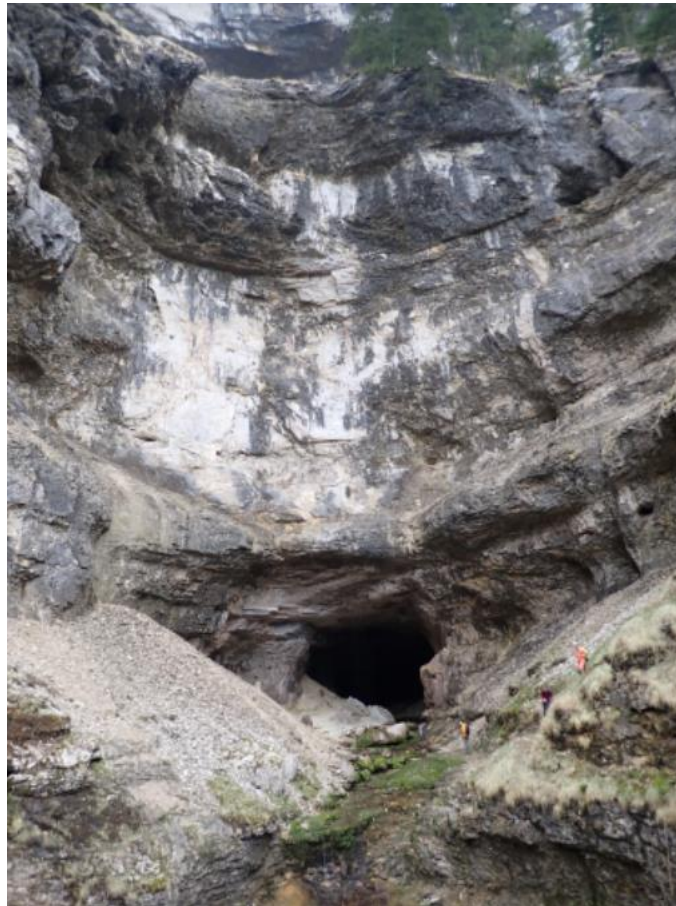
Figure 4 : L'entrée de la grotte.