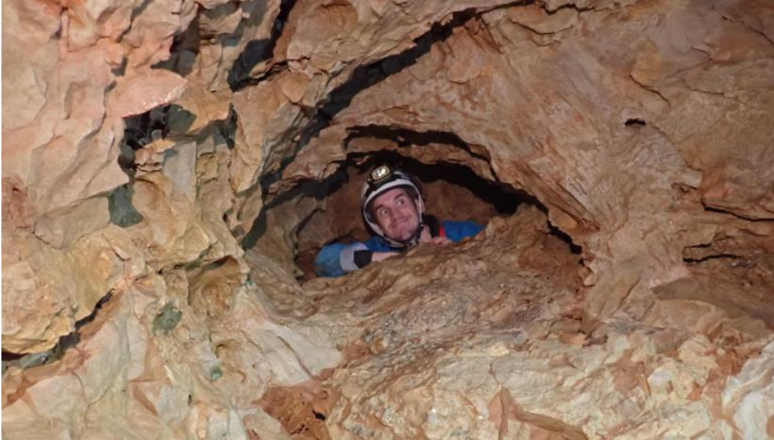
Figure 6 : Espèce endémique locale au sourire inquiétant (Photo Noémie).