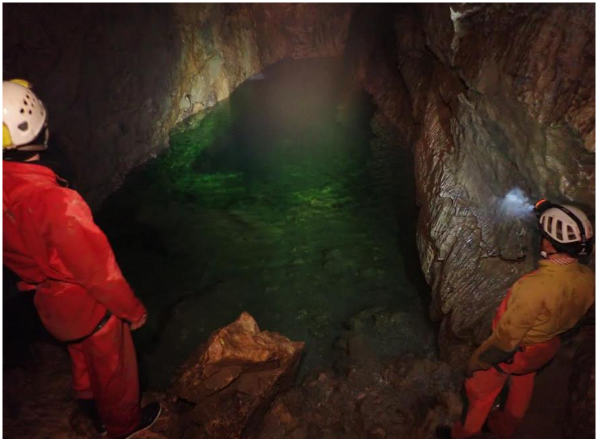
Figure 8 : Le grand siphon de la grotte.