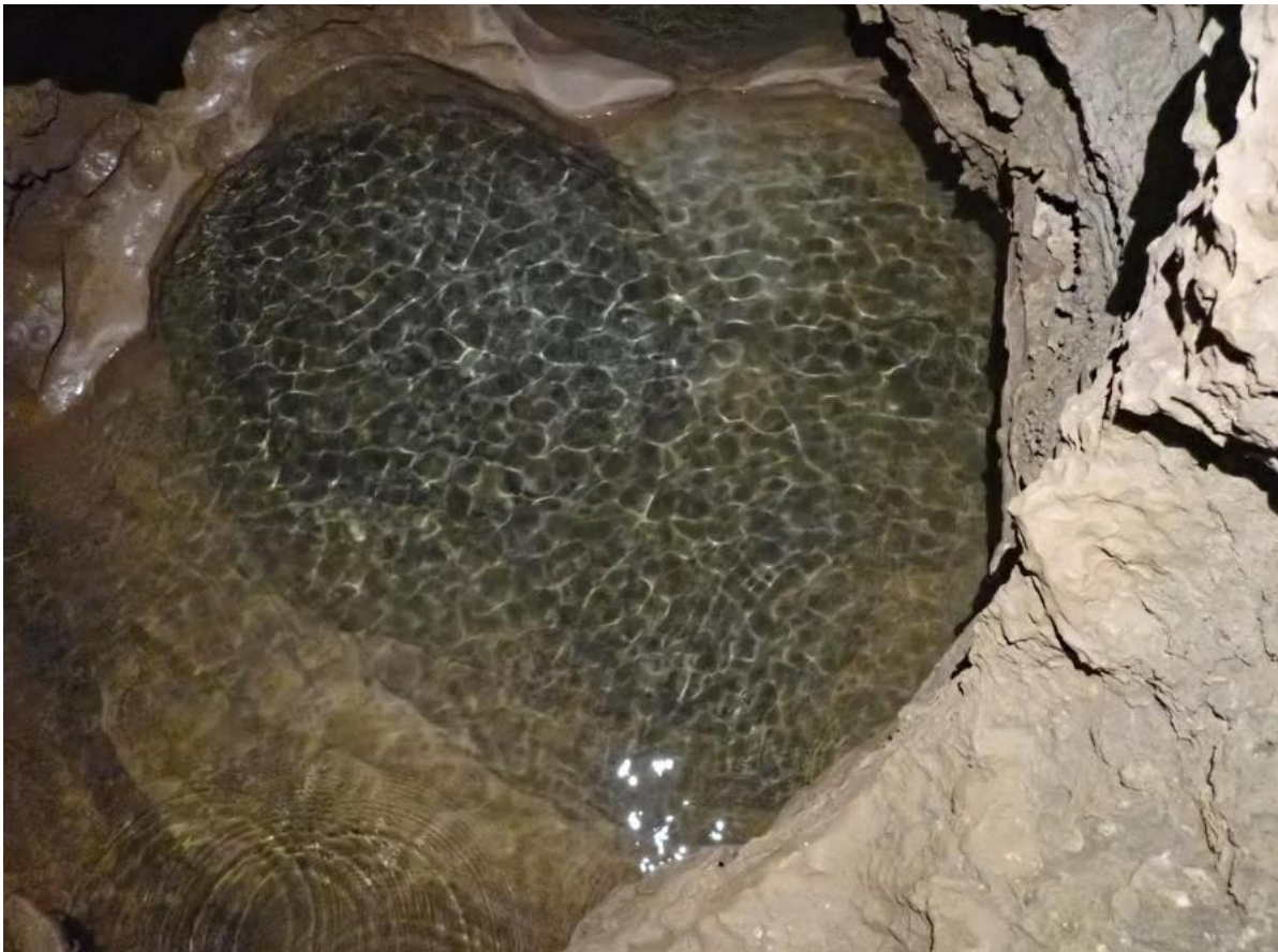
Figure 7 : Une des marmites du « Couloir des marmites ».