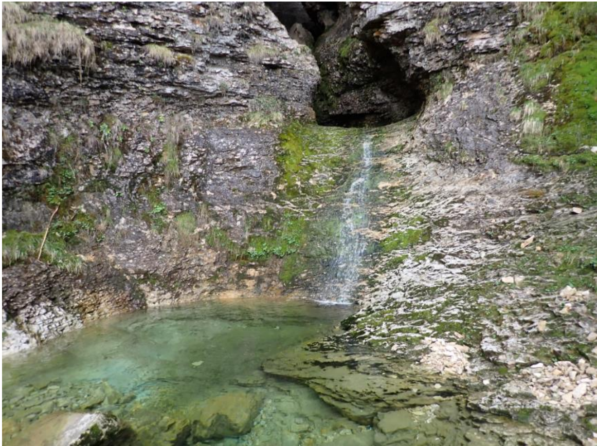
Figure 2 : Les vasques après le « Pas du Mort » et avant l'entrée de la grotte.