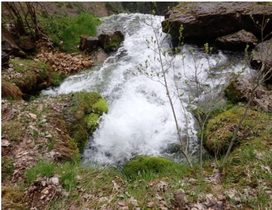
Figure 3 : Les remous visibles dans une des vasques après le « Pas du Mort ».