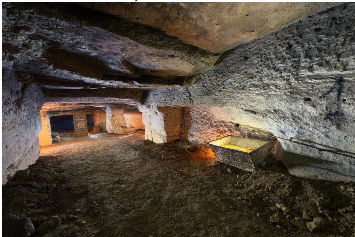
La descenterie d'accès à la petite carrière...

C'est pourtant ici qu'une innocente plaque d'égout nous fait basculer dans l'univers fongique des anciennes carrières franciliennes, que nous reconnaissons bien.