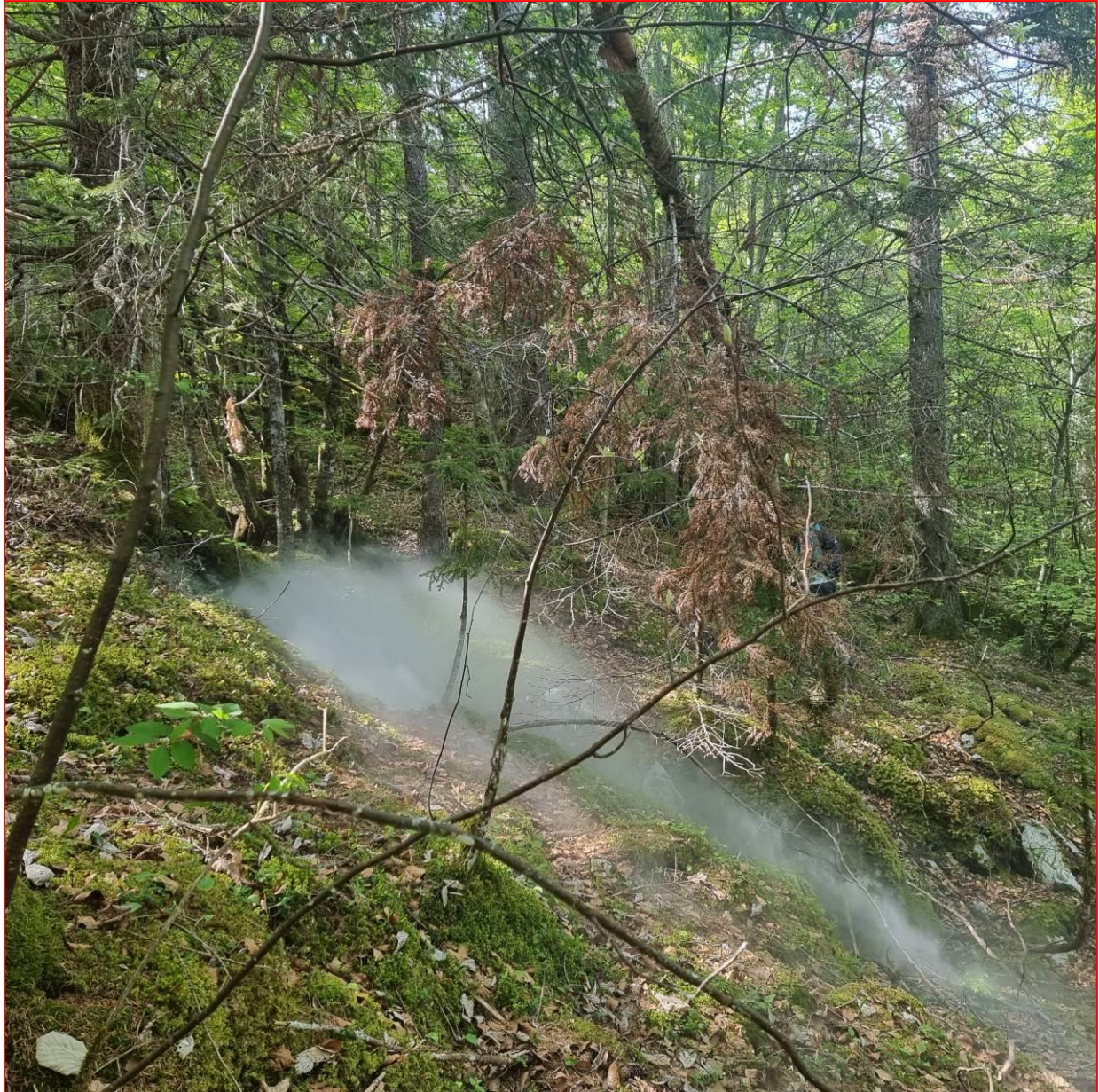
Dragon Bauju

attirés par les colonnes de fumée ressortant par les narines d'un dragon bauju d'un genre nouveau. Bref, on n'est guère avancé par cette expérimentation qu'il fallait malgré tout tenter. Reste peut-être une carte à jouer : à l'aide d'une bâche tendue entre parois, boucher la sortie juste à l'aval de la trémie pour forcer l'air à d'avantage emprunter le passage du bas et, avec ou sans feu, affiner cette expérimentation.