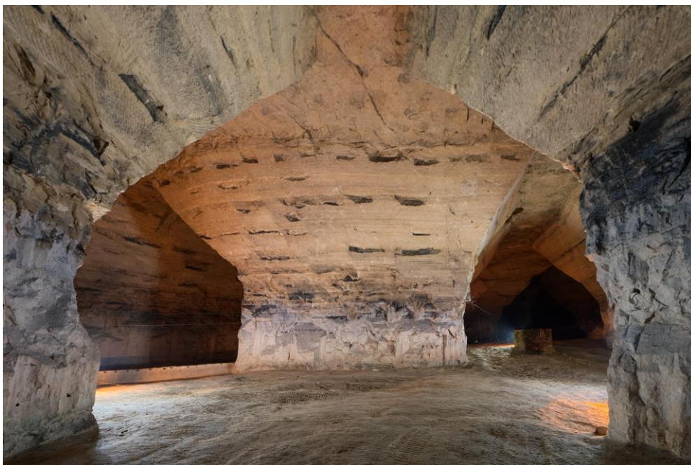
Grands volumes. Derrière ce pilier se trouve le puits.

Nous nous rendons à une carrière dont je connais l'existence depuis 2015, accessible par un puits d'une quarantaine de mètres. Depuis mon dernier passage en surface (je n'y suis jamais descendu faute de compère de corde), la végétation a bien poussé, mais ce ne sont que ronces et renouées du Japon. Cependant, deux arbres font l'affaire pour s'amarrer et Louis m'a prêté son protège corde. Je ne suis pas très confiant mais Pierre maîtrise. De toutes façons il n'y a pas d'autres solutions: le puits aurait été trop large pour placer la chèvre, et hors de question de spitter dans l'alésage du puits, en briques. Je m'équipe, je m'affaire à amarrer la corde de 66m aux sangles, et c'est parti. Le puits semble en bon état, et après une franche verticale, l'atterrissage se fait sur un tas de poubelles après avoir abouti dans le plafond d'une vaste salle. Le détecteur d'O2 indique 20.9%, l'ambiance est fraîche, et les volumes sublimes.