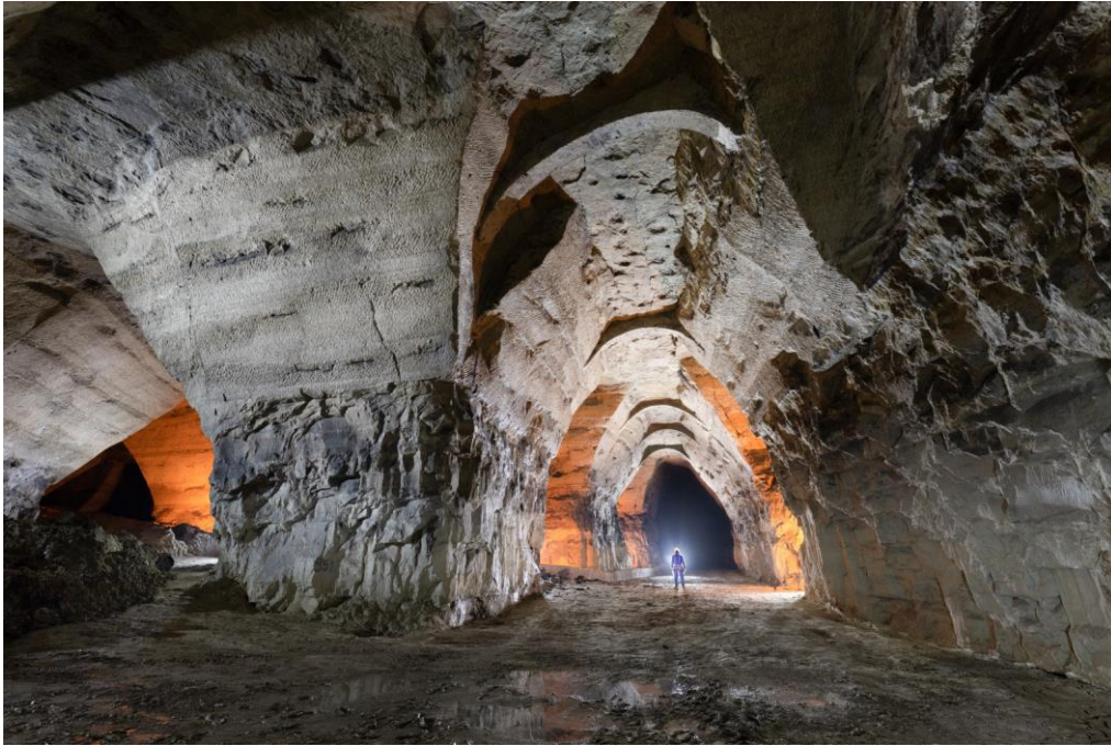
Je prends la pose dans la grande galerie des arches.

Pierre finit par me rejoindre en bas. Le réseau est assez petit, cerné d'effondrements. On ne visite en effet qu'un cinquième de la surface décrite sur notre documentation. On distingue un quartier supérieur avec des "petites" galeries de 6 à 8m de haut, et un quartier inférieur où se trouvent le puits avec la grande galerie aux arches, de 11m de haut.