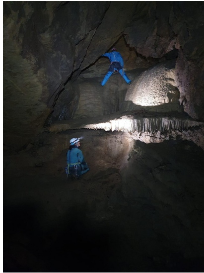
Escalade pour accéder au mini réseau fossile

Je prend le déséquipement et après 5h10 sous terre nous sommes dehors.