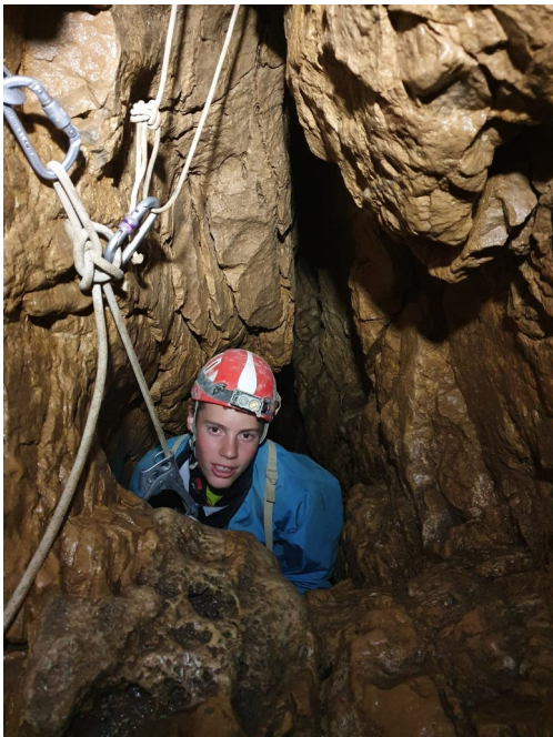
Remonté dans le 1 er puits

Je prend le déséquipement et après 5h10 sous terre nous sommes dehors.