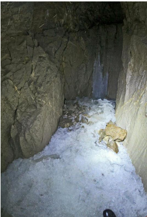
Le fond de glace pilée, vers -50.