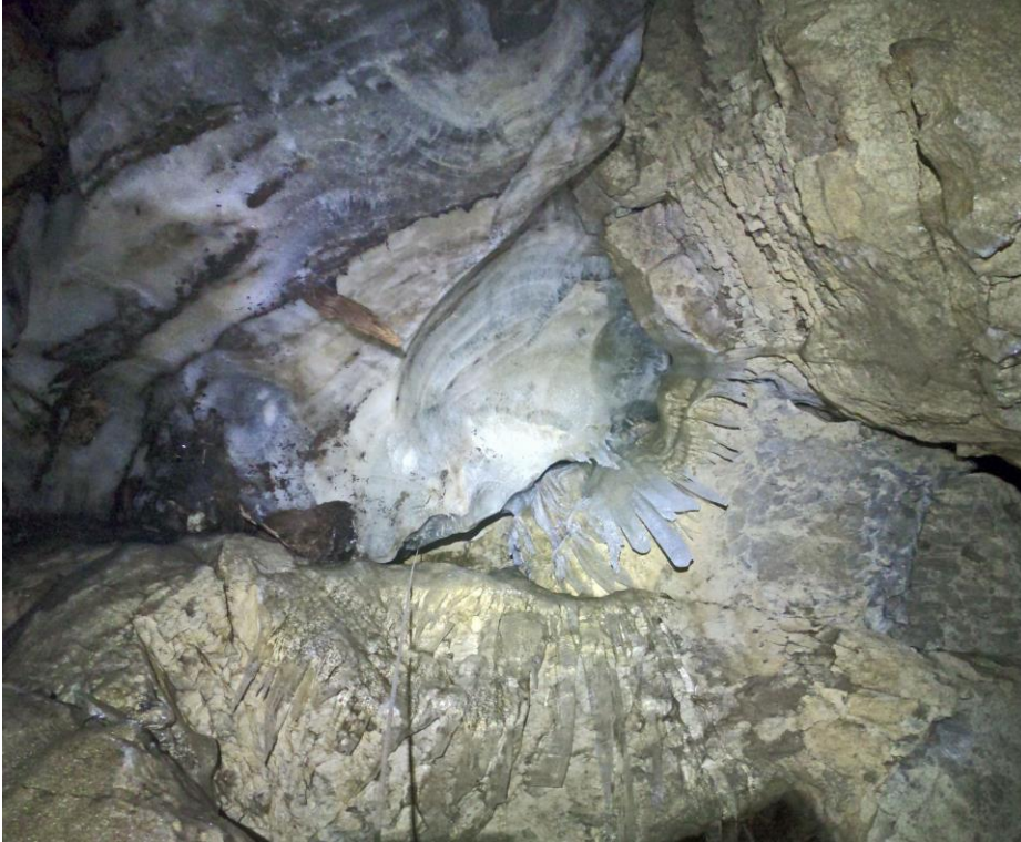
Le culot de glace suspendu, on devine la corde en bas vers le milieu.

Au point bas s'ouvre, sous la glace, un puits où nous nous enfilons après avoir mis un pulse. Nous dépassons un culot congelé puis dérapons sur des blocs pour échouer au point bas du trou.