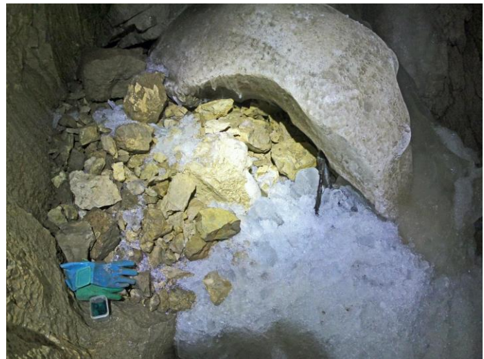
Le point bas, des blocs sous la glace.

Nous remontons en faisant la topo. De retour dans la salle nous la traversons en direction d'une galerie confortable, ébouleuse, dont le fond est percé de deux puits redonnant sur le passage terminal inférieur.