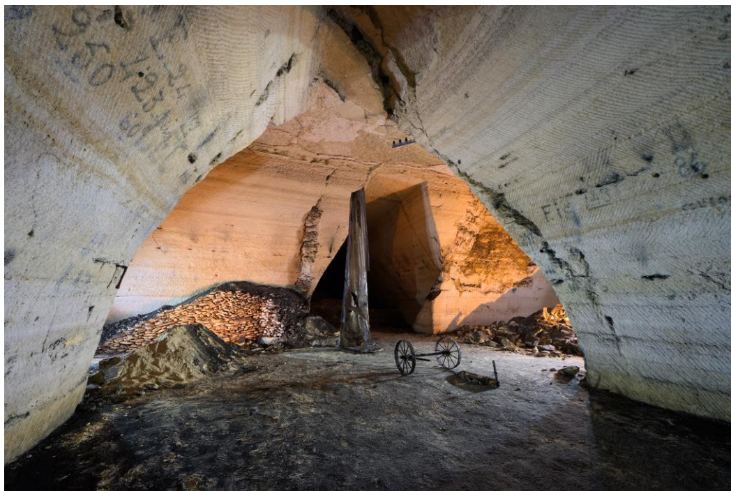
L'une des galeries les plus au Sud. Derrière nous se trouve la carrière Bouty, aujourd'hui disparue.