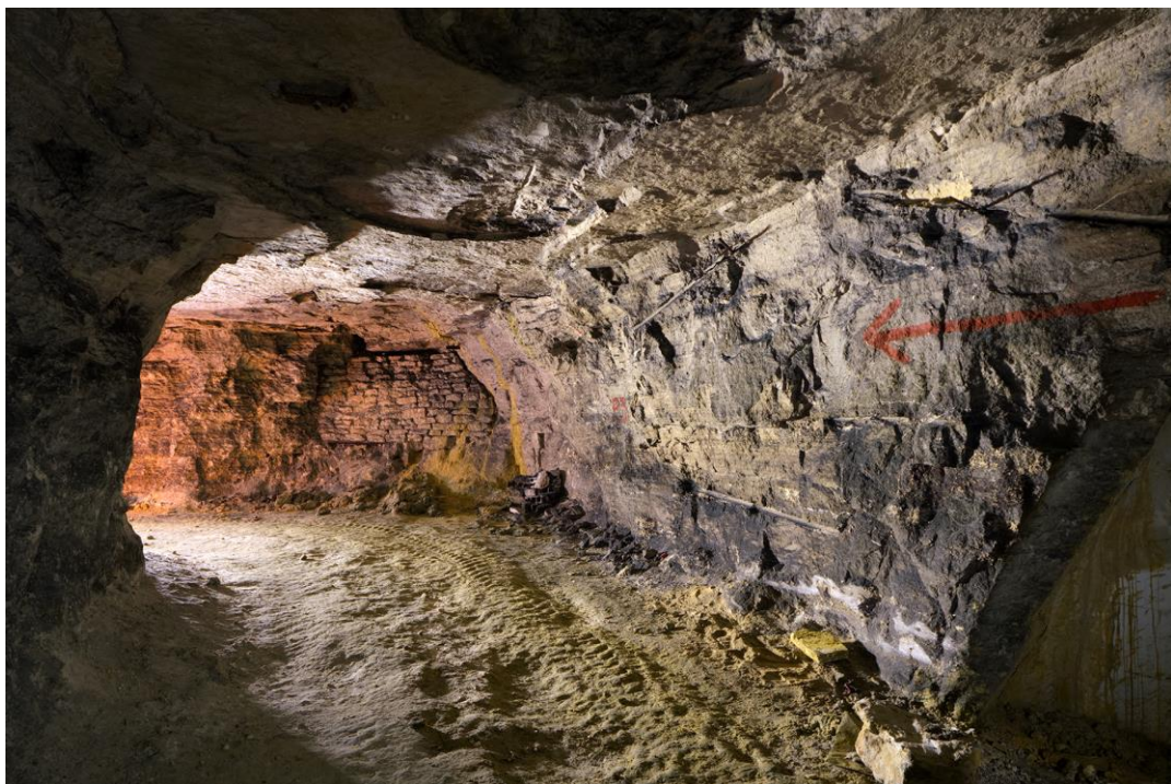
La jonction des années 20, entièrement percée à l'explosif.