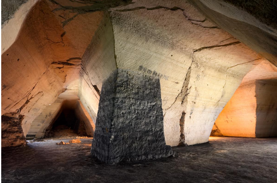
Un fort confortement de pilier dont les angles ont souvent fâcheuse tendance à vouloir s'écarter. La seule exploitation des bancs tendres et la seule utilisation du pic traduit un chantier antérieur au XXe siècle.

En repartant, je fais aussi une vue de la jonction créée par le dernier exploitant de la carrière, permettant de lier les F*ntenelles avec l'entrée actuelle. On va aussi zyeuter le passage vers le grand lac que nous avons traversé à plusieurs reprises de 2014 à 2016 : l'eau est montée de 10 à 20cm, est devenue rouge (d'après Manu, cela serait dû à un bidon d'huile de pelleteuse sans doute entreposé lors des travaux de consolidation de 2008, qui aurait crevé), l'air est vicié et a une odeur de H 2 S, et de nouveaux désordres se sont formés : de gros blocs et des tas de marnes. Nous éviterons à l'avenir de retourner dans cette zone qui semble désormais condamnée.