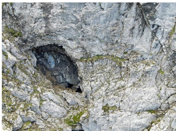
Petits départs en bas à droite ?