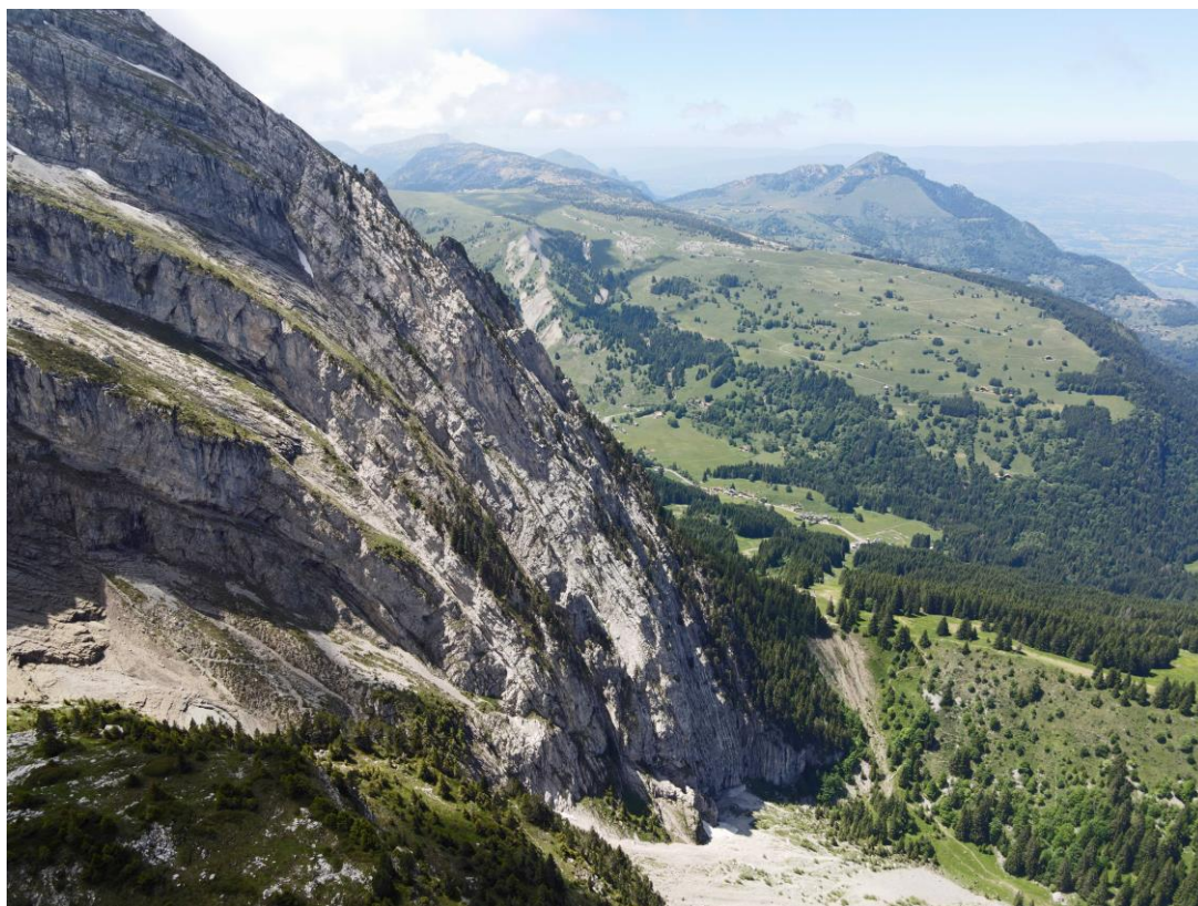
L'anticlinal du Bargy et ses strates plongeantes, le trou est dans la falaise près du milieu.

Arrivés au col nous descendons d'une centaine de mètres jusqu'à un promontoire en vision directe avec le porche convoité. Là il n'y a pas de vent et une fois l'estomac bien calé j'envoie le drone vers les à-pics en face.