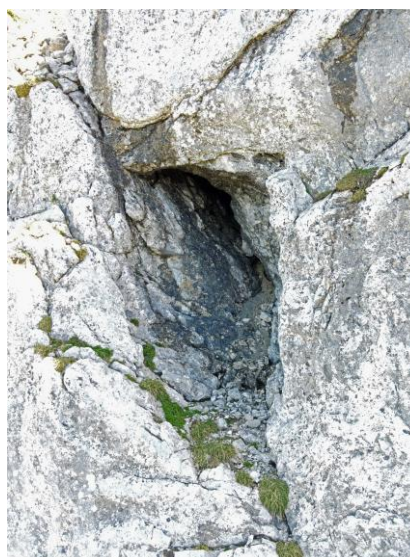
Porche sans suite.