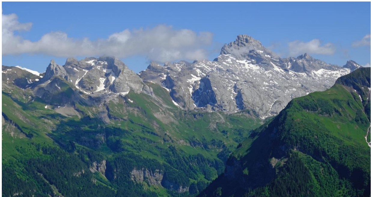
La chaîne des Aravis avec la Pointe Percée et ses lapiaz...

Arrivés au col nous descendons d'une centaine de mètres jusqu'à un promontoire en vision directe avec le porche convoité. Là il n'y a pas de vent et une fois l'estomac bien calé j'envoie le drone vers les à-pics en face.