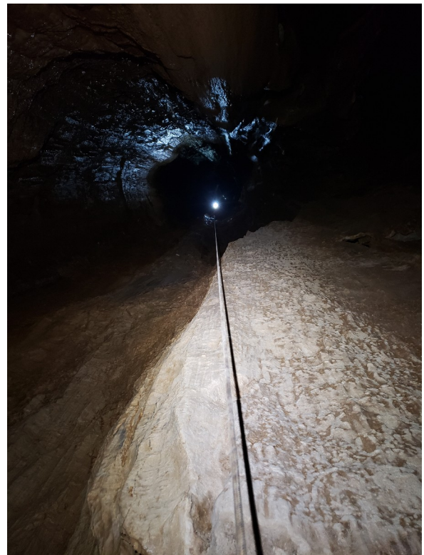
Regard vers le haut depuis le bas