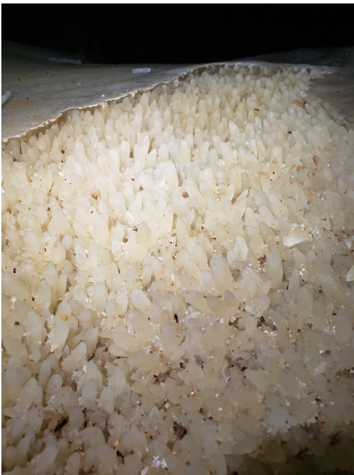
Quelques cristaux un peu après le gour