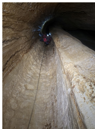
Les puits d'entrée