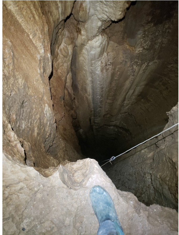
Sur la grosse margelle à mi-puits