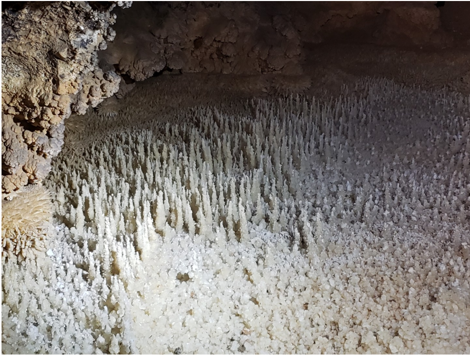
Le gour des soldats