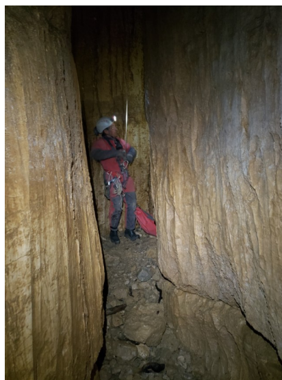
A la base des puits d'entrée