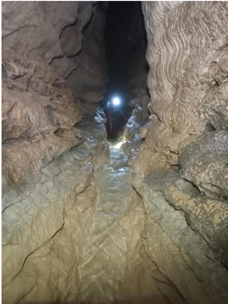
Petit filet d'eau dans le méandre