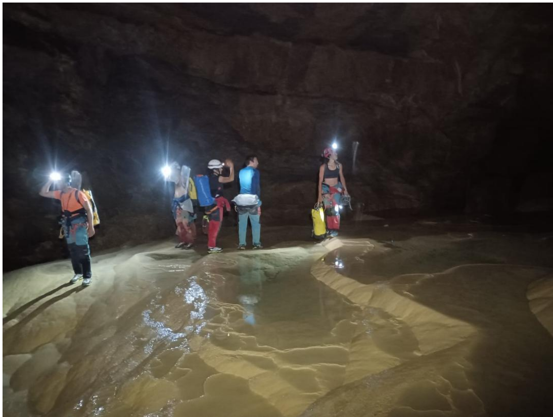
Dans la galerie fossile, au niveau de la Cascade Rouge (il me semble), la marche nous a réchauffée