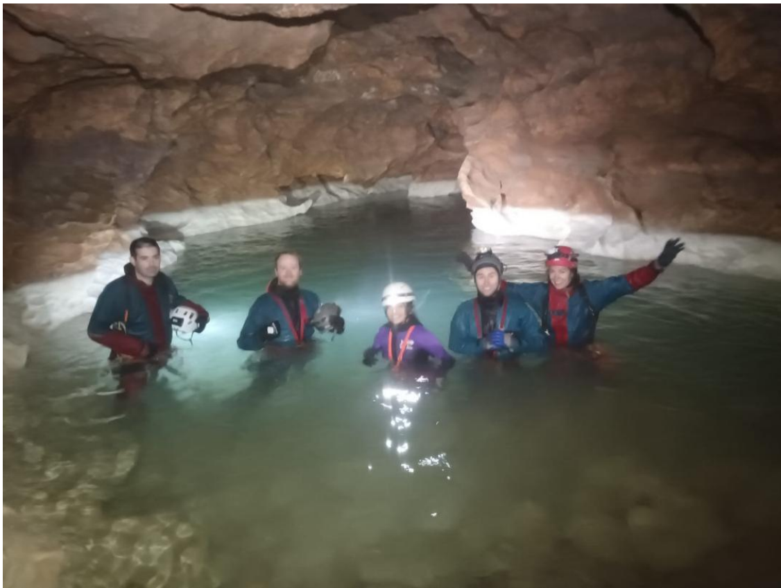
Une photo dans le siphon S1