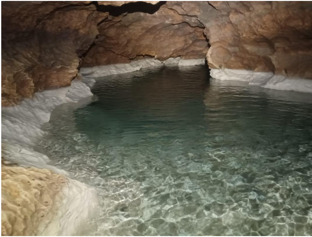
Le siphon S1 avec ses 35m de nage, maintenant désamorçé, qui sera le terminus de notre sortie