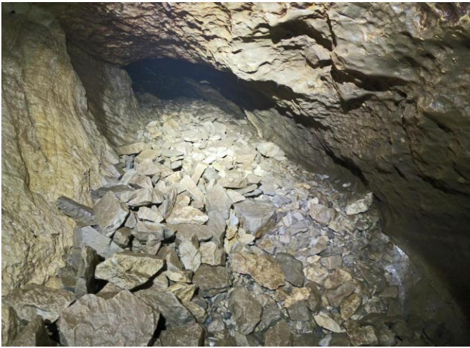
Eboulis charriés par l'eau, de bas en haut.