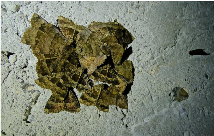
Un amas de papillons au plafond près de l'entrée !