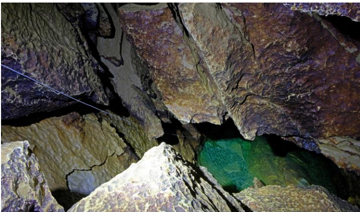
Descente vers le siphon.

Un peu de fraîcheur en cette période trop chaude... Rien de tel qu'une petite rando tranquille le long du Rhône en amont de Bellegarde, pour emprunter la galerie artificielle donnant accès au réseau actif de la Bouna, regard sur le collecteur de cette partie du Jura. En tenue « civile » nous allons jusqu'à la voûte basse où je laisse ma compagne. Je mets un pantalon néoprène pour passer celle-ci mais ne me mouille qu'à mi-cuisses. Et je vais voir le siphon, qui grâce à la sécheresse est encore plus bas qu'en novembre lorsque j'étais déjà venu : 10 m en dénivelé depuis la petite plate-forme de départ en hautes eaux. On arrive au niveau où il part quasiment à l'horizontale.. Je fais quelques photos puis nous ressortons tranquillement.