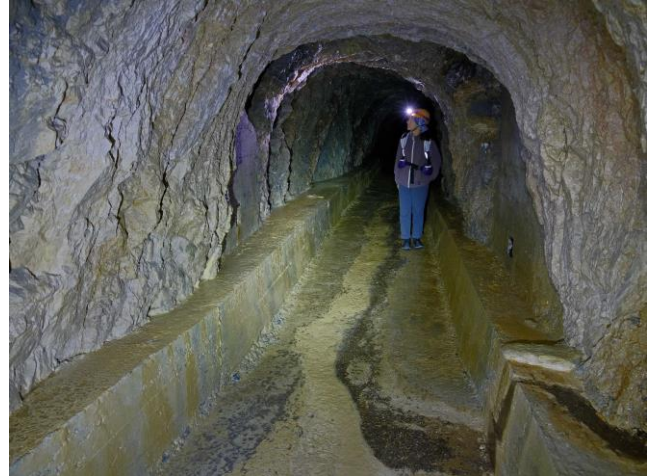
La galerie artificielle d'accès.