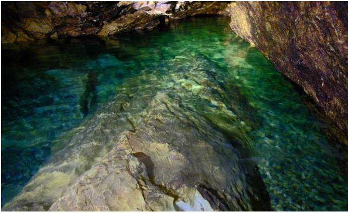
L'eau est très limpide !