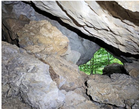
et de dedans.