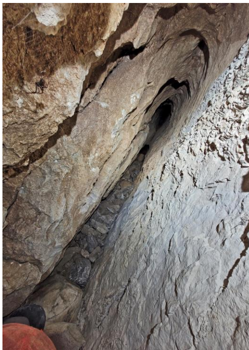
La fissure inclinée.