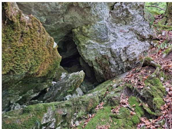
L'entrée, vue de dehors...