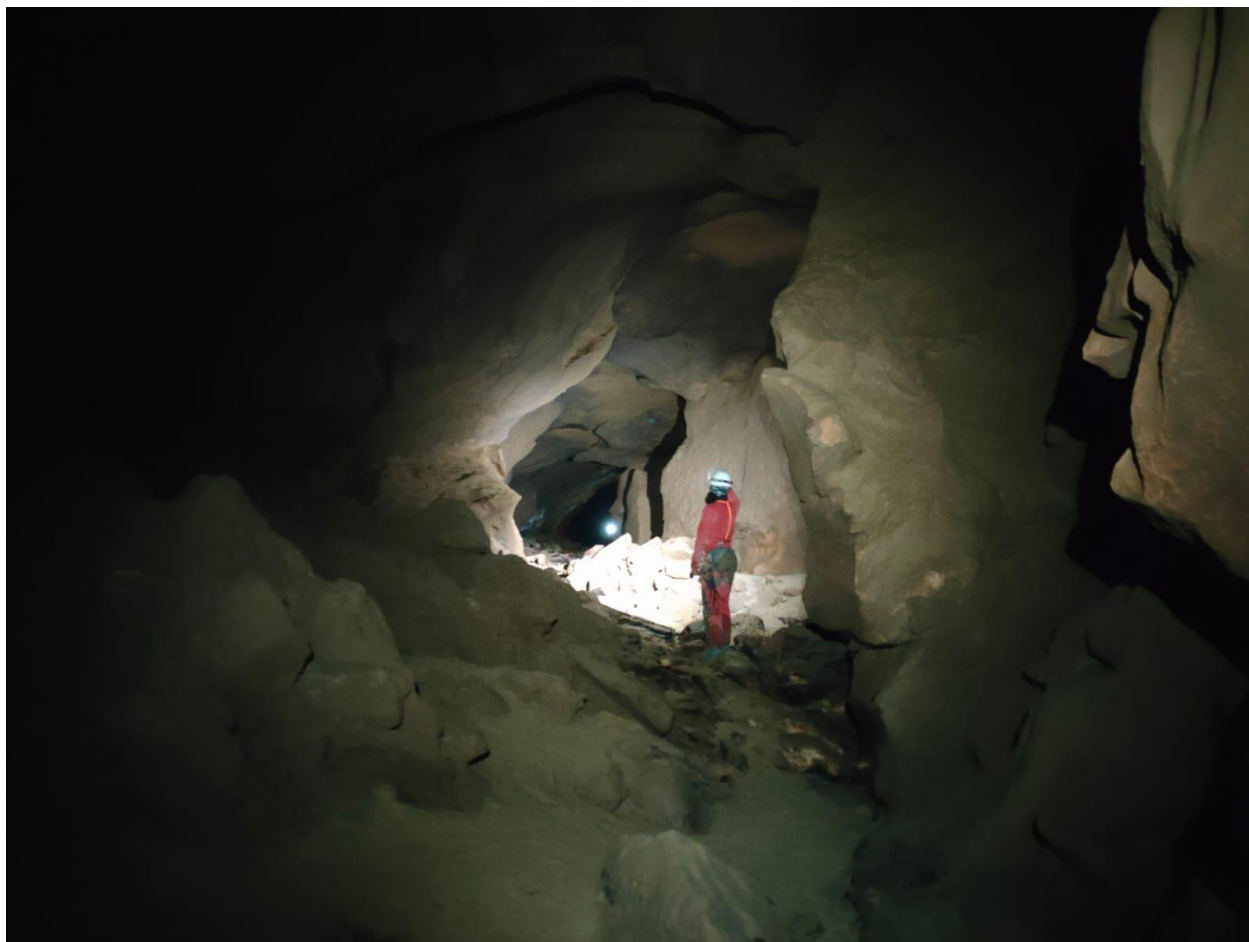
La galerie François Nord avec la voute mouillante