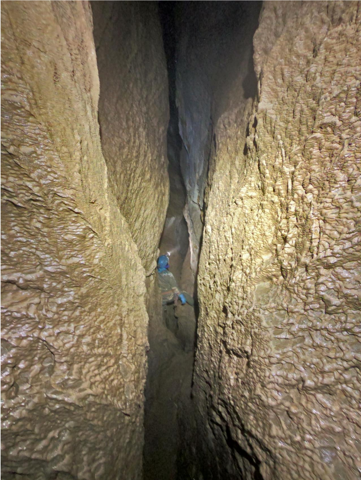
Dominique au Terminus (vers -500m ?)