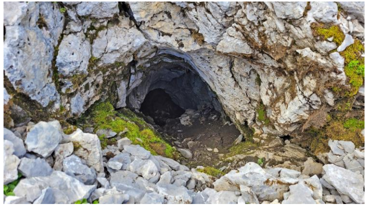
Le B29, avec l'Etale en arrière-plan. Le boyau annexe.

Enfin je vais voir le trou le plus haut, à 2180 m, sorte de petite perte que je déballe un peu mais il n'y a pas de courant d'air. En revanche, en redescendant, je « tombe » sur une entrée modeste mais soufflant fortement. Je me glisse en m'écorchant, faute d'avoir eu le courage de remettre la combi, arrive sur une salle ébouleuse en pente raide où il faudrait mettre une corde. Une vieille marque illisible B... montre que le trou est déjà connu. A revoir.