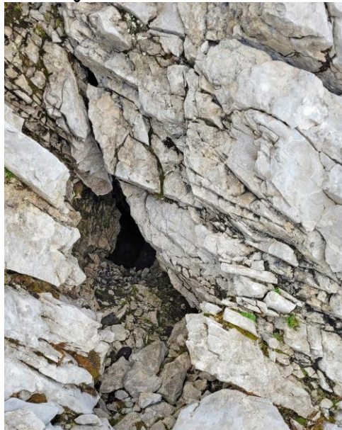
Le trou souffleur.