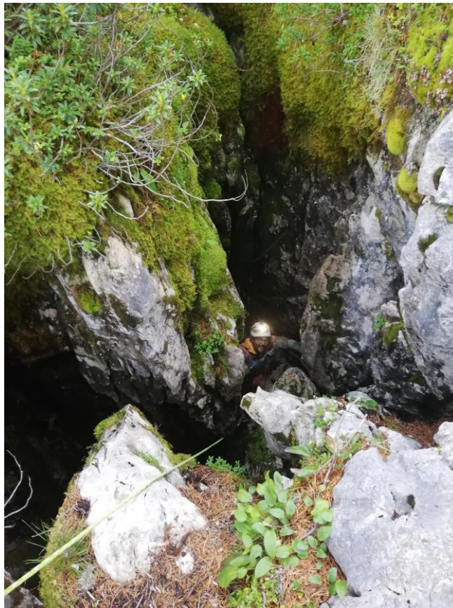
Figure 4 : Valentin sort victorieusement du scialet Jeunesse d'Automne.