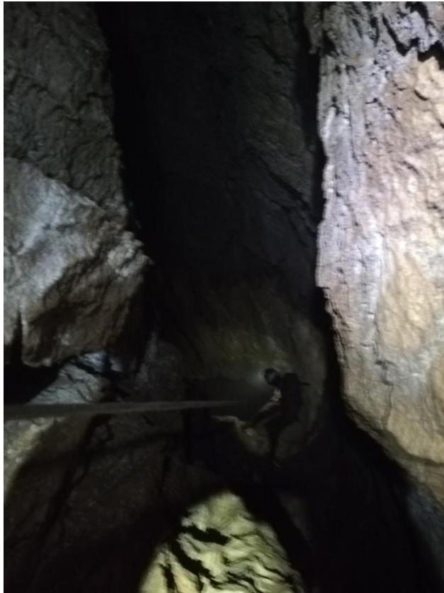
Figure 3 : Valentin descend dans le Puits of Princess.