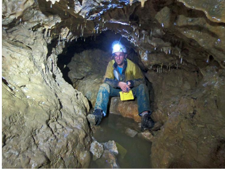
Le conduit peu avant le boyau.