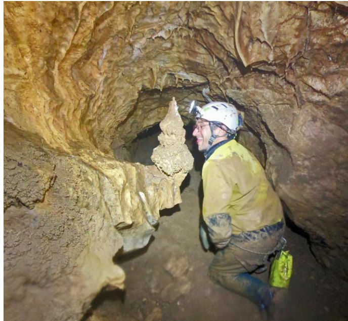
Miam, la bonne glace italienne !