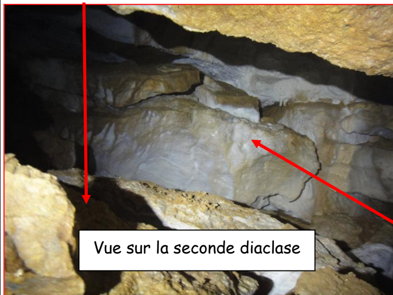
Vue sur la seconde diaclase

Ici, la hauteur passe à 2m50. Côté sud, cette diaclase pince sur un planché de calcite blanche recouverte d'un film d'eau (amont). De gros blocs empilés bordent le côté ouest masquant un éventuel départ, non ventilé, de tout façon impénétrable en l'état. La suite est à chercher à l'autre bout (côté nord). Une