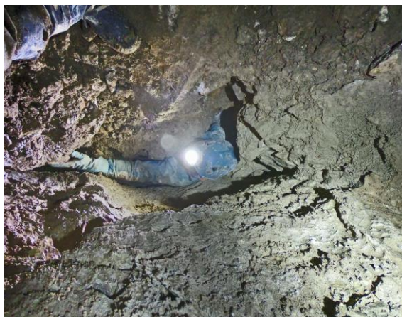
Le voilà qui ressort de son trou.