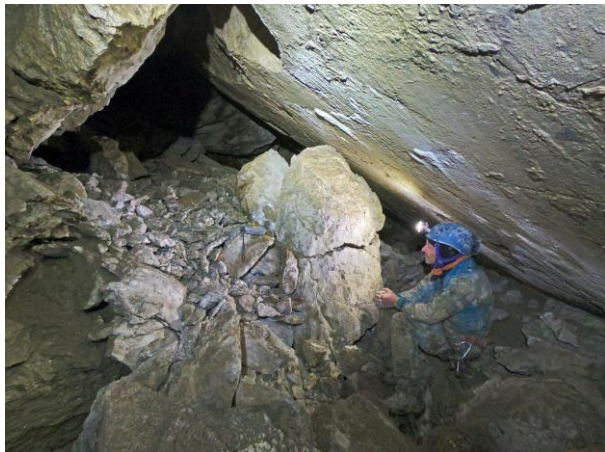
Bas de la galerie, rive droite.