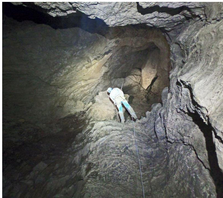
Domi remonte le P20 terminal.