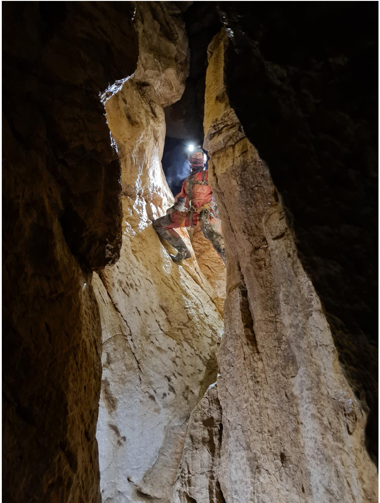
Valentin en action