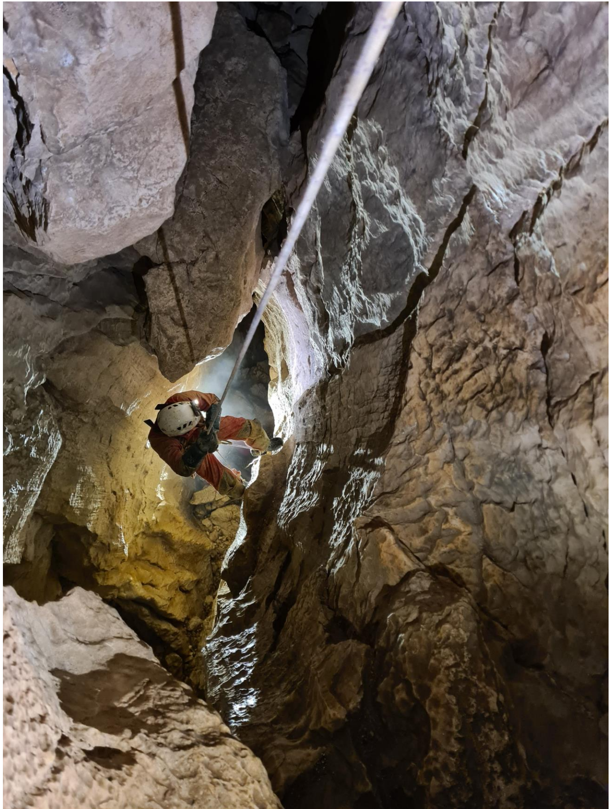
Romain, vers le bas des puits