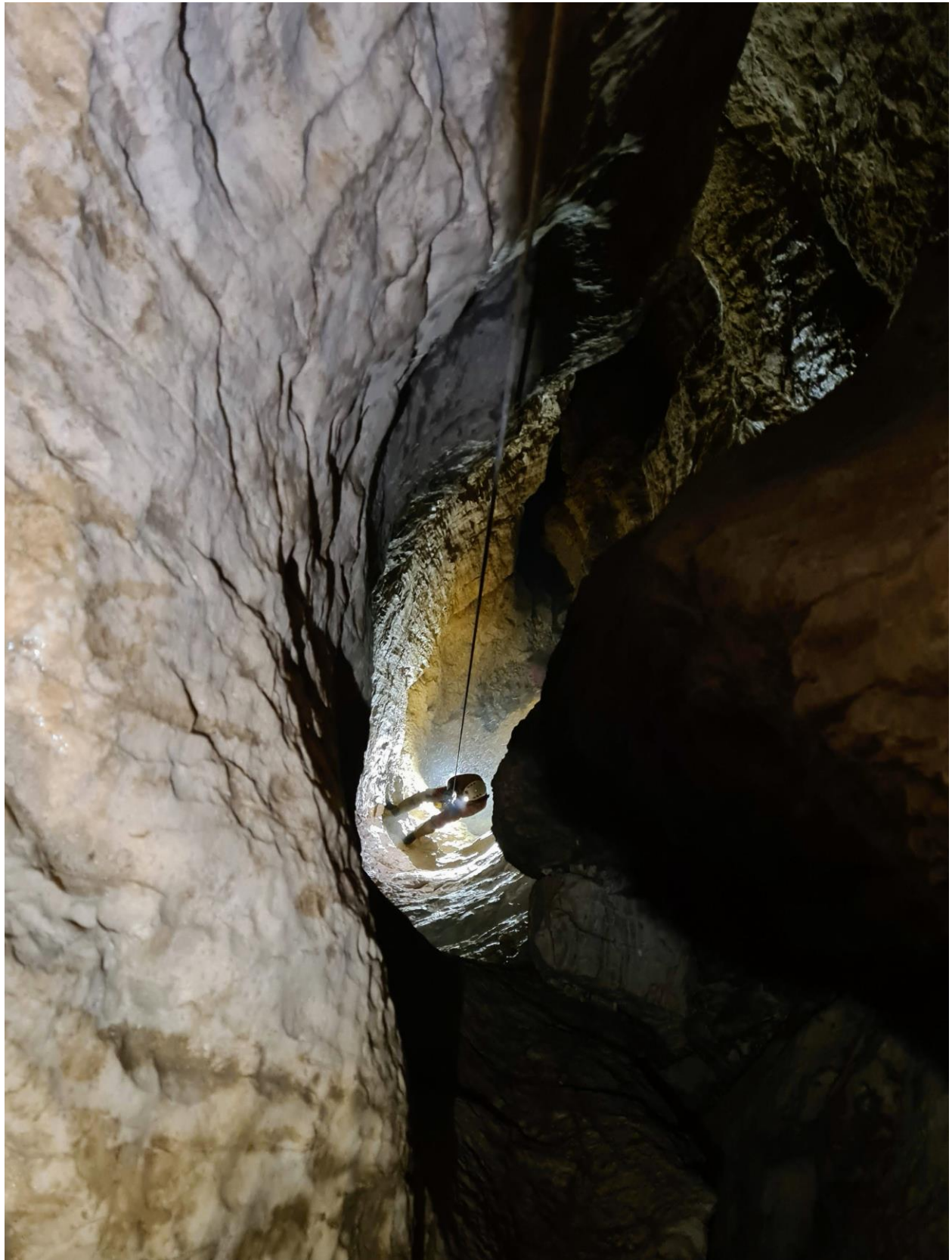
Demier puits, sous une petite douche