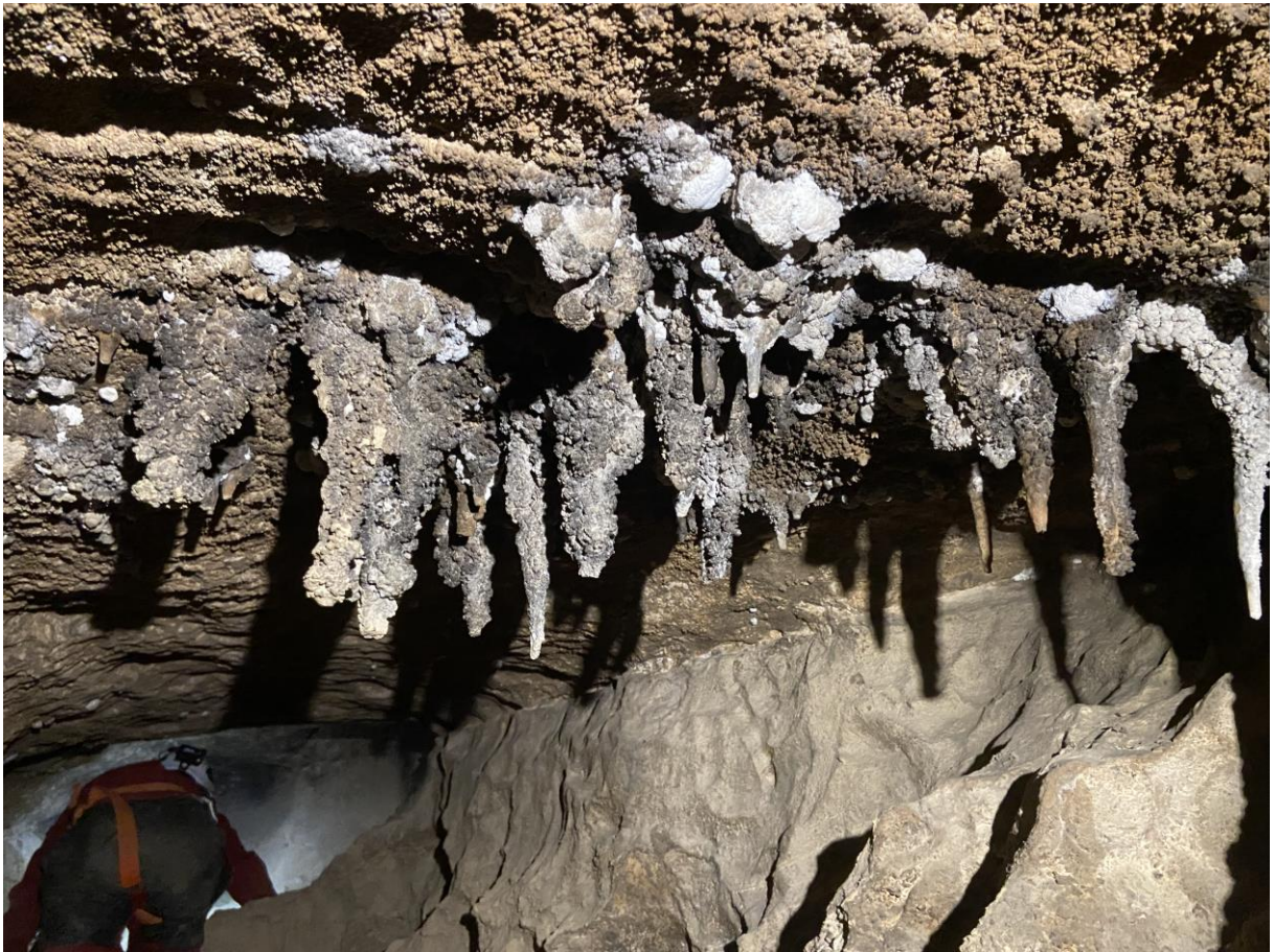
Les très vilaines petites concrétions de la galeries des marmites