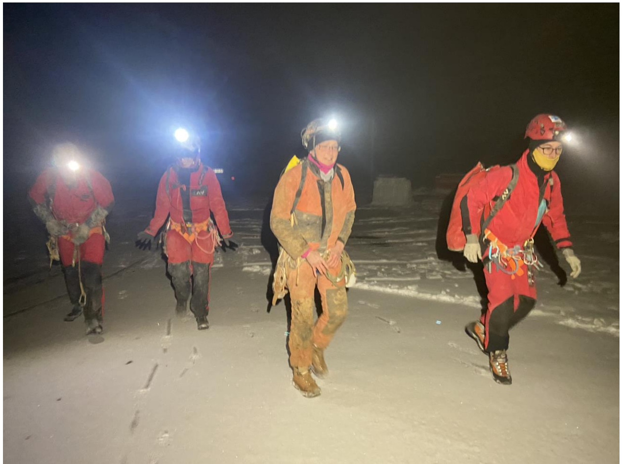
Au départ