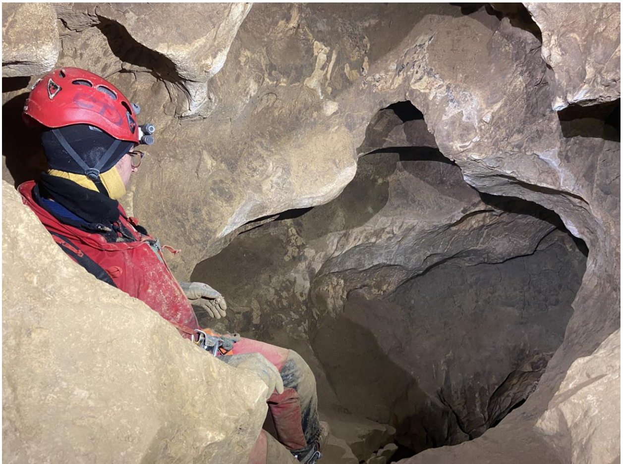
Le décevant P15 de la galerie des marmites