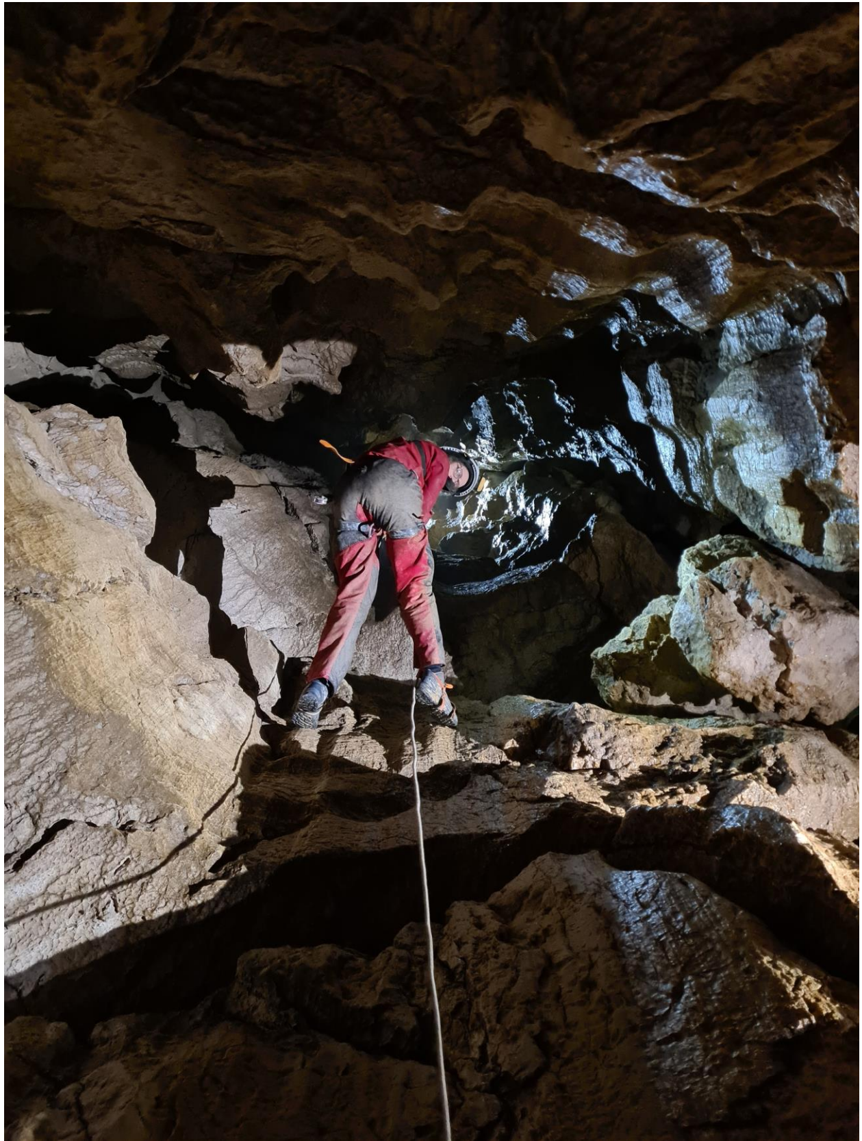
Gabrielle en action