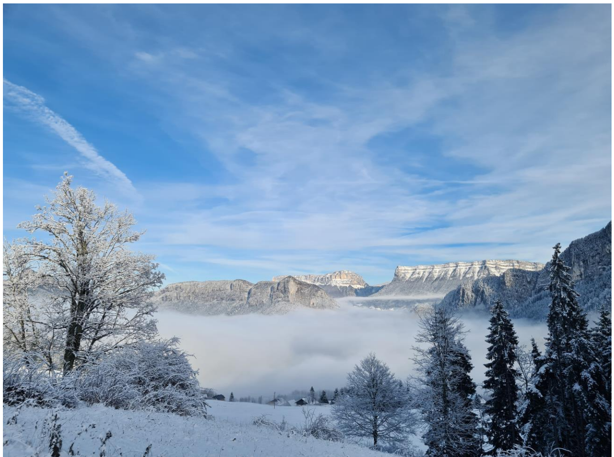
A la sortie !