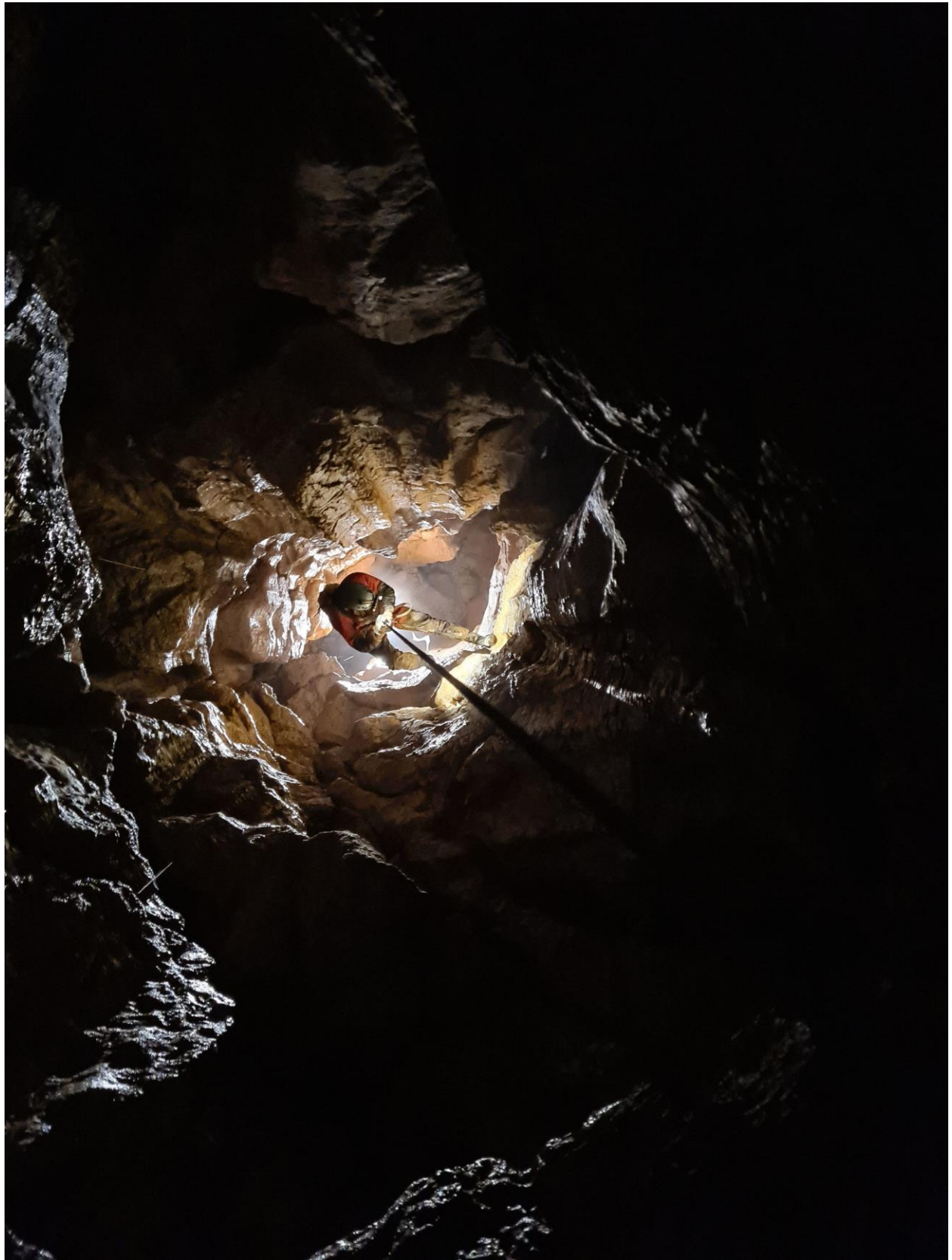
La sortie approche