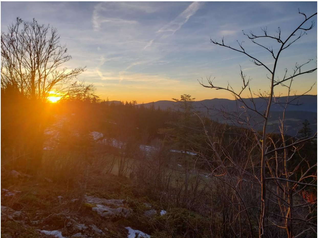
On sort pour le coucher de soleil