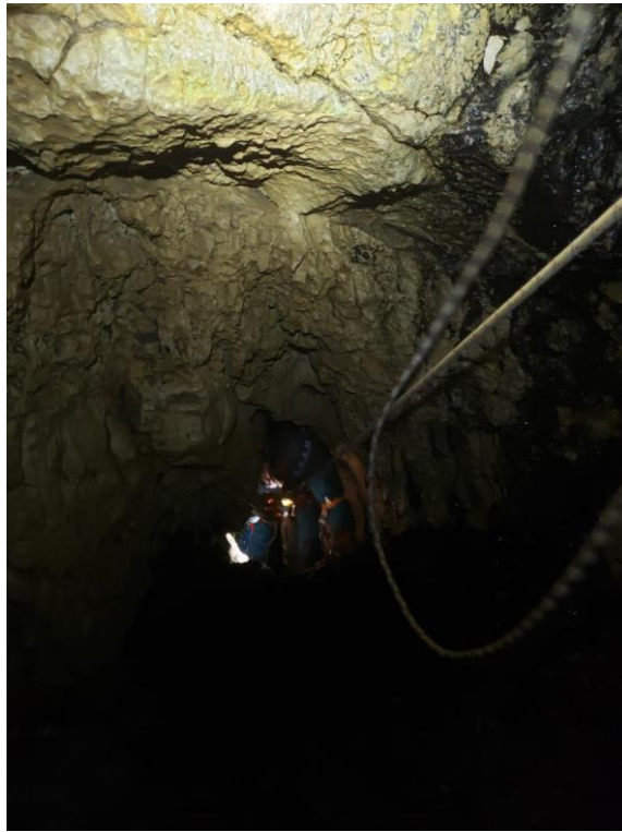
Hugo dans un puit