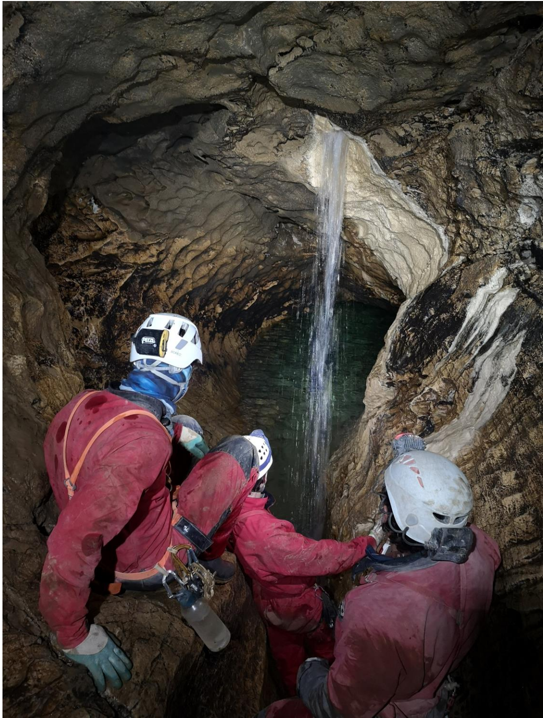
Siphon de la Verna