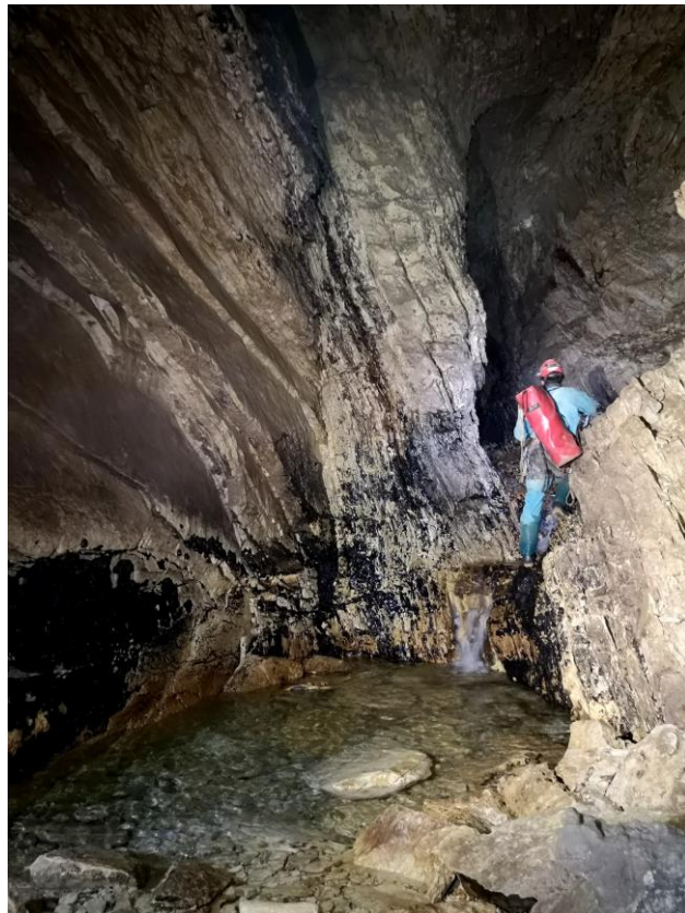
Au dessus de la salle à manger