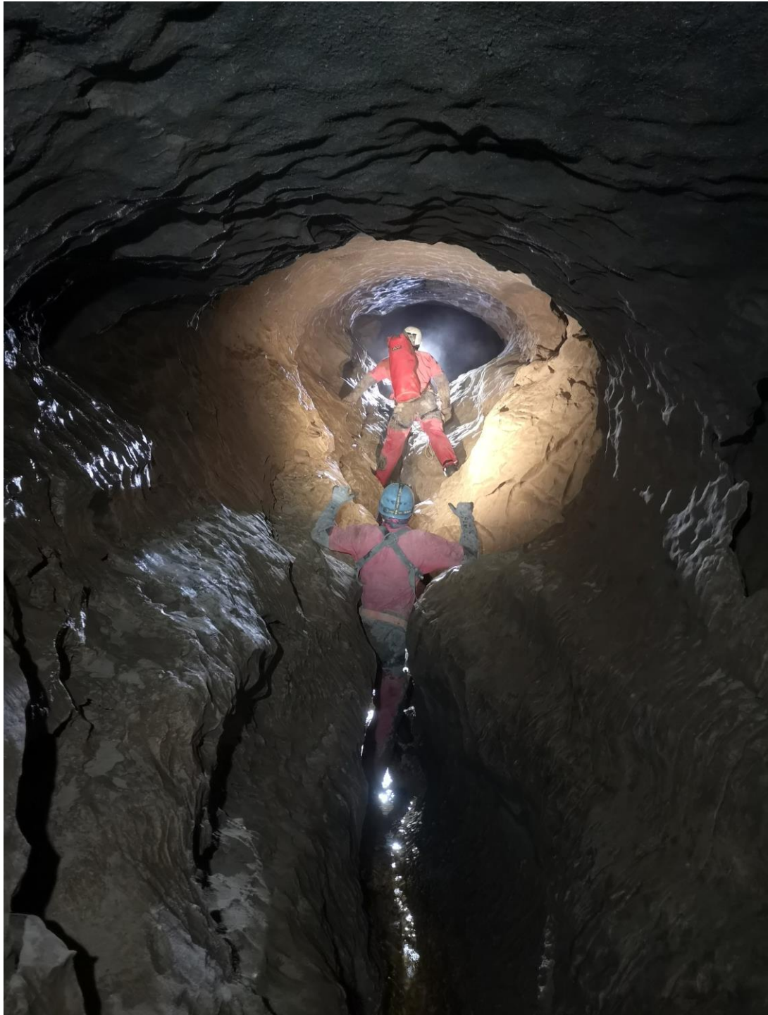
Un bien jolie méandre