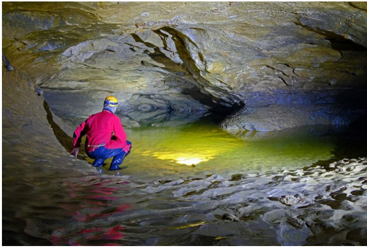
Le siphon vers la Soufflerie.