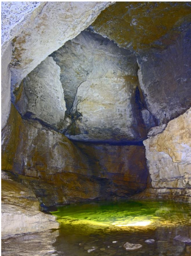
Le lac et la vire des Perroquets.