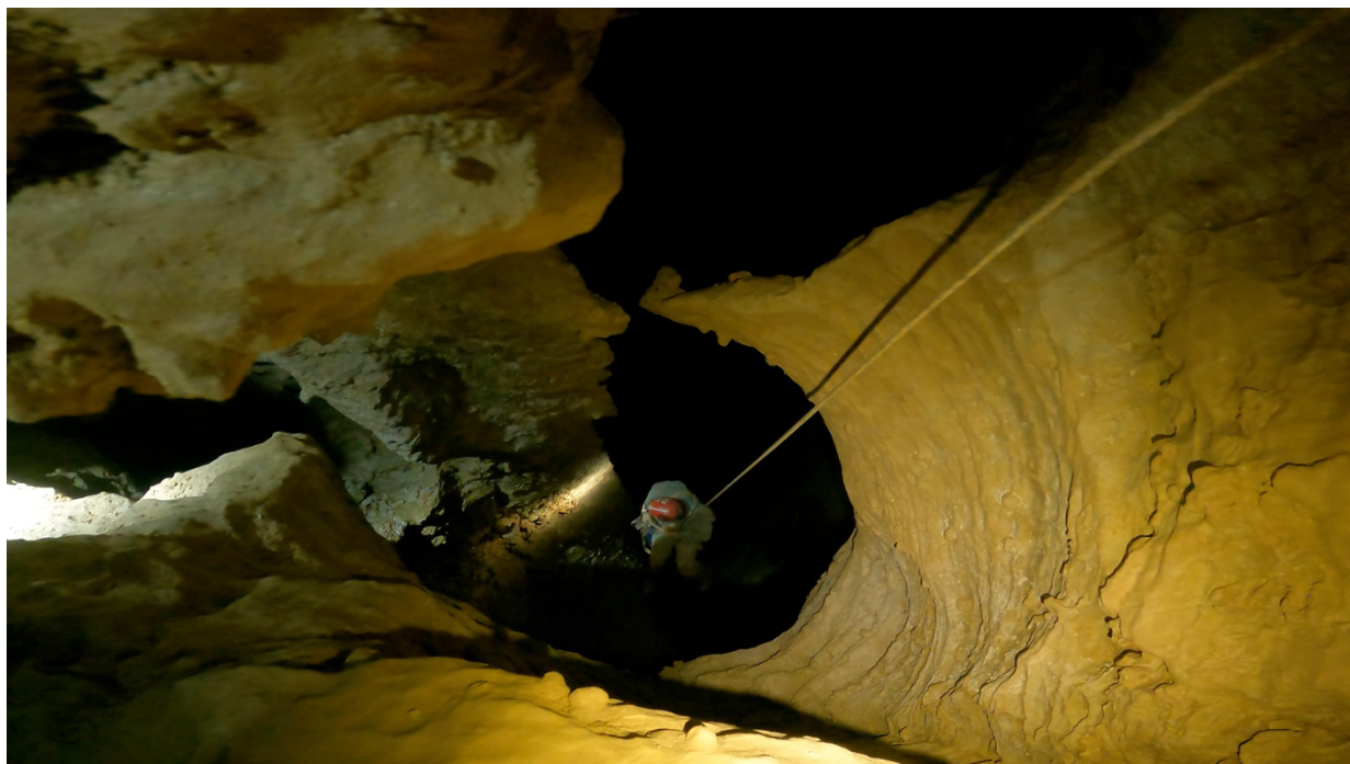
Le puits des eaux intrépides