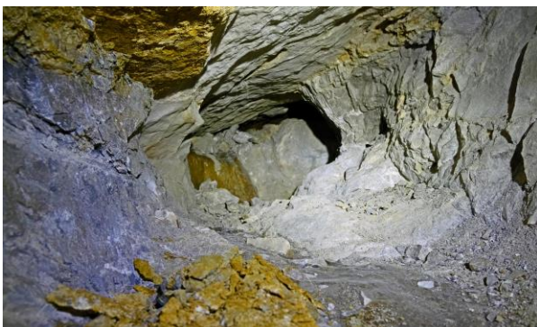
Le boyau à élargir.