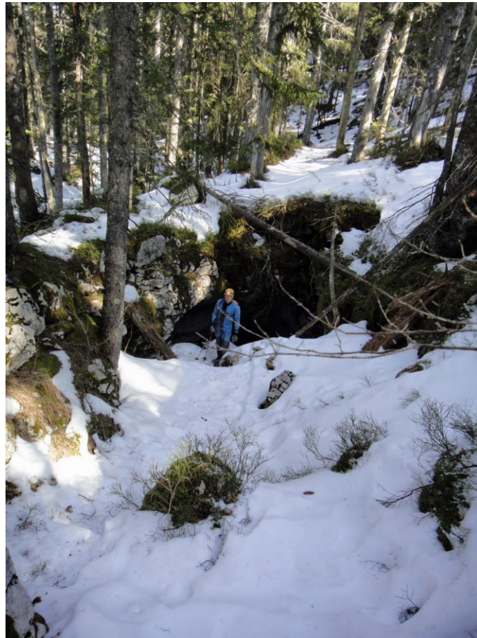
L'adieu (?) aux Nodules.