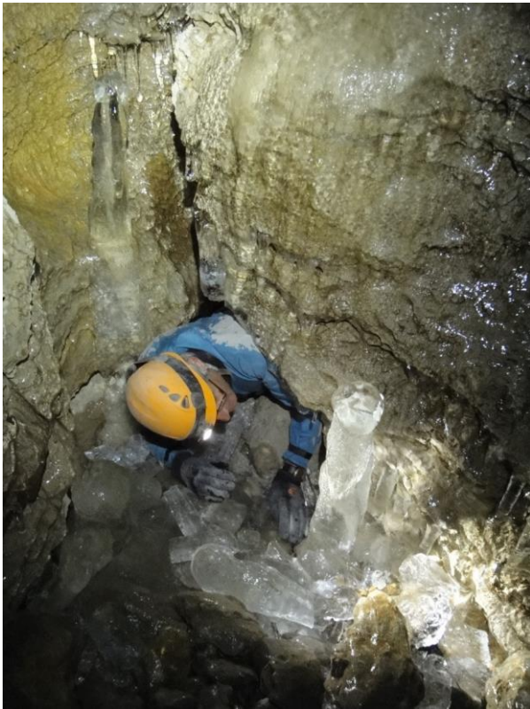
Accès aux réseaux supérieurs.