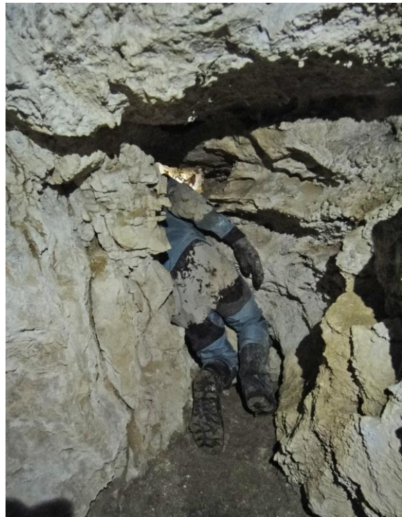
Le méandre soufflant.