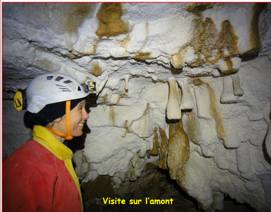
Visite sur l'amont