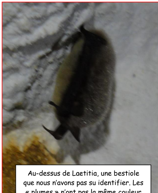
Au-dessus de Laetitia, une bestiole que nous n'avons pas su identifier. Les « plumes » n'ont pas la même couleur entre le devant et l'arrière