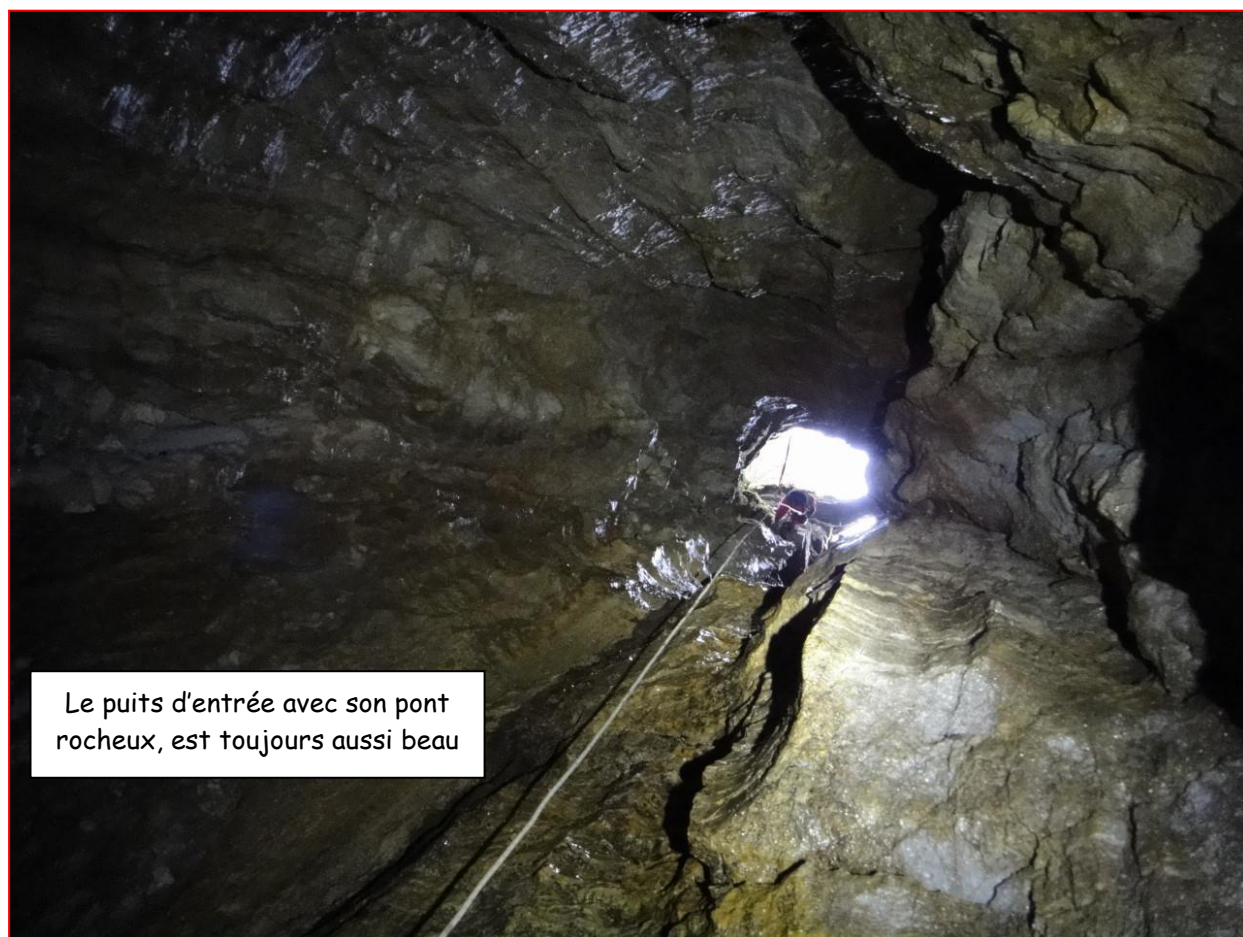
Le puits d'entrée avec son pont rocheux, est toujours aussi beau