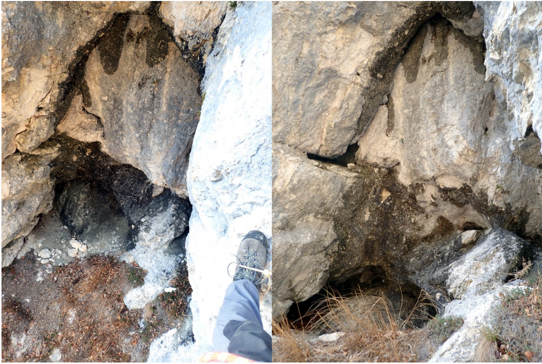
Approche de la « grotte » : 3...2...1...zéro (de chez zéro) !