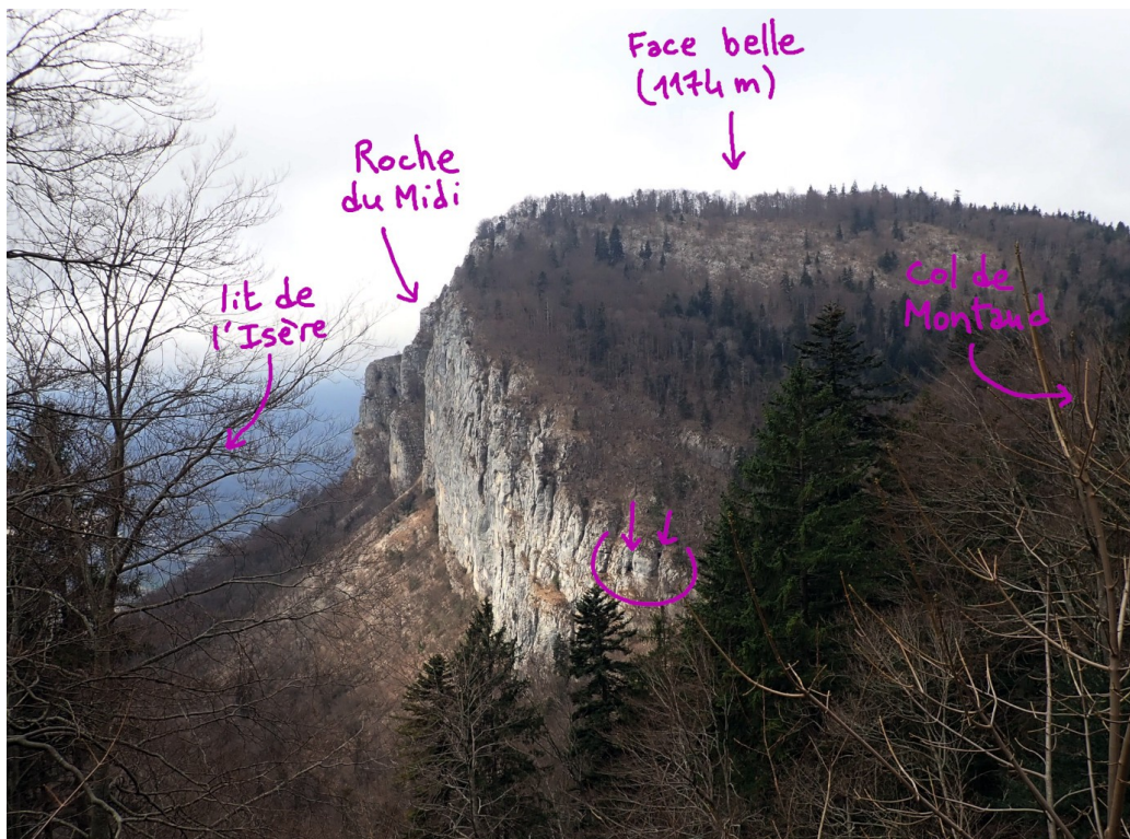
Photo prise en direction du N depuis la piste sous le Bec de l'Orient

En ces lieux les falaises du Vercors barrent la vue vers l'est et on pourrait se sentir bas par rapport au plateau. Pourtant le potentiel vertical existe toujours puisqu'on trouve à quelques encâblures de là, plus au nord, un scialet qui s'insinue près de 300 m sous la surface, le trou du Grec. Les lacets de Veurey et Montaud se chargent également de nous rappeler qu'on est loin du niveau de la plaine.