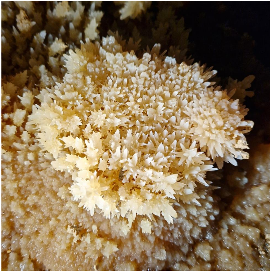
Dans le gour de cristaux