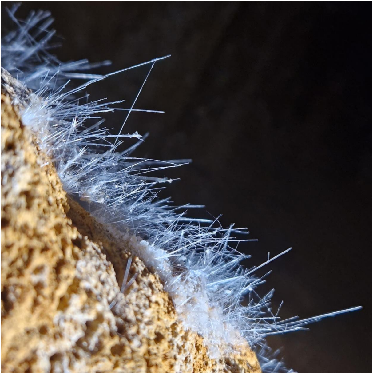
Aiguilles de Gypse