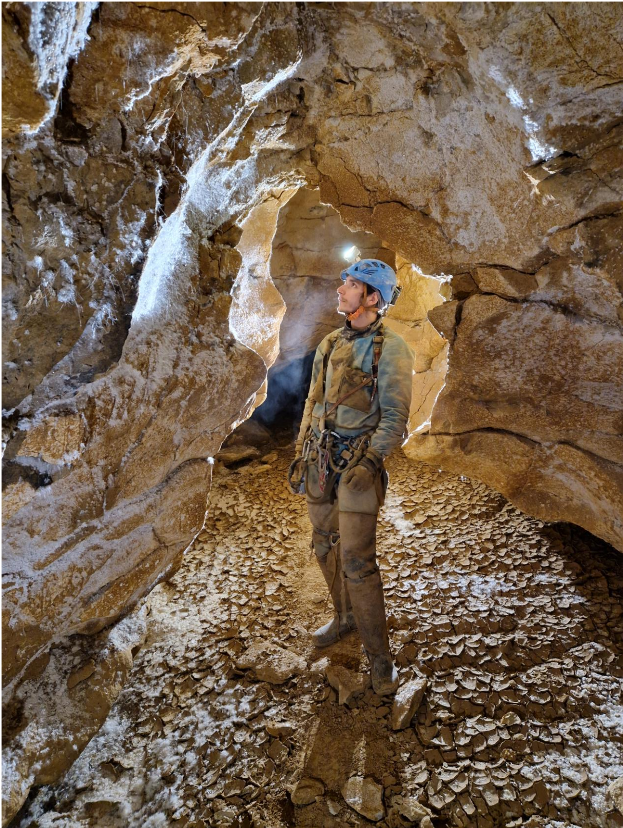
Sevan dans la galerie du Sahel