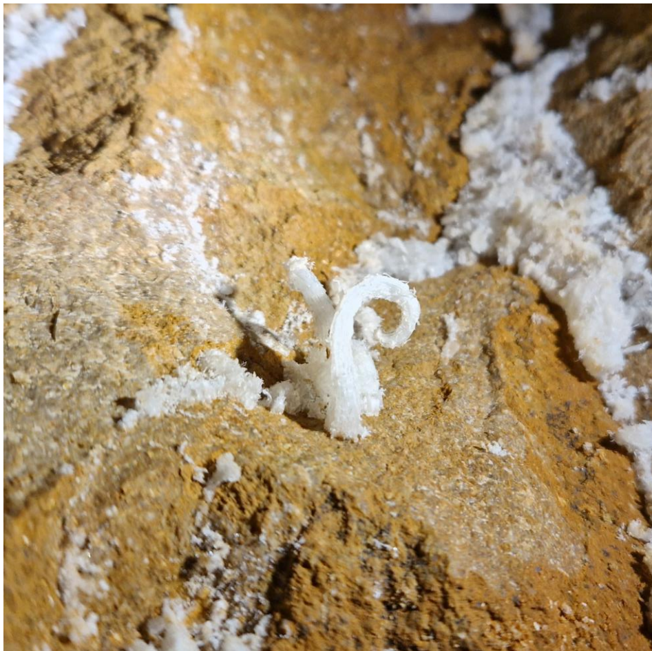
Fleur de gypse