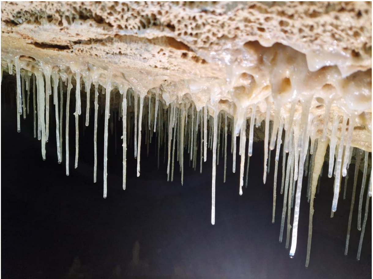
Plafond de fistuleuses dans la galerie Baboune